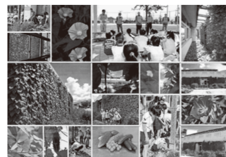
最優秀賞の押原小学校作品