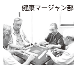
健康マージャン部

お住まいの地区のいきがいクラブ会長または 町社会福祉協議会内いきがいクラブ連合会事務局 (☎275・0640)