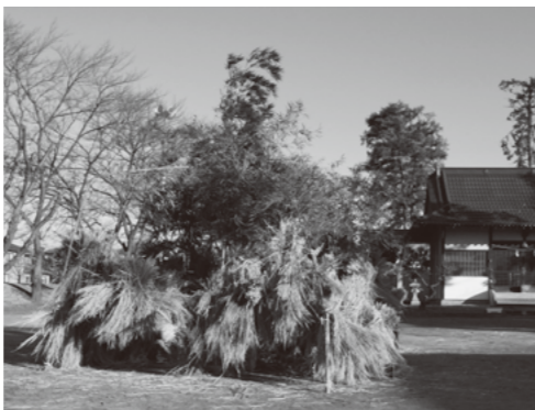
獅子舞とどんどん焼きのやぐら (河西)

1月9日(土)から14日(木)にかけて町内各地で、小正月の伝統行事が行われました。獅子舞、どんどん焼、繭玉の餅花づくりなどで親しまれる小正月の行事は、同じ昭和町内でも内容も規模も様々です。中には150年以上前から連続と続いている地区もあるという伝統行事。春を呼ぶ小正月の一コマを紹介します。