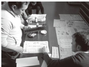
伝統の版木でのお札づくりと昔ながらの道祖神前でのどんどん焼き (上河東)