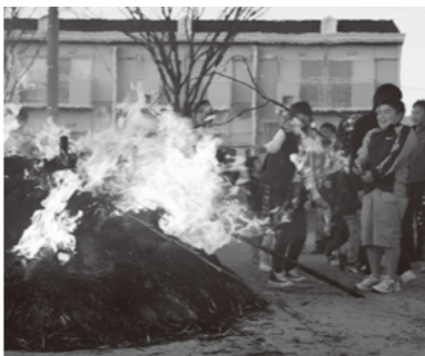
天高く建てられたやぐらのどんどん焼きと獅子舞 (紙漉阿原)