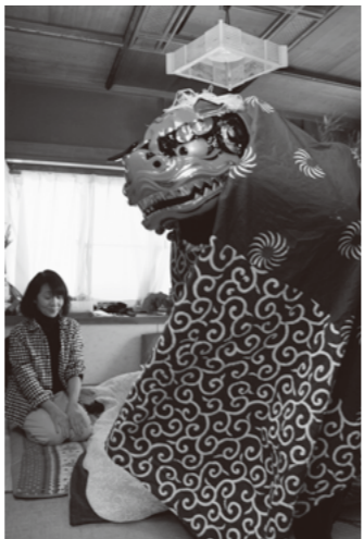
子供たちを集めての繭玉づくりと家々を巡る獅子舞 (飯喰)