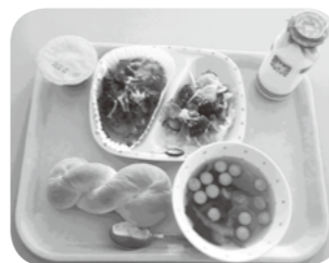
お楽しみ給食の例

ハロウィン給食 (ツイストパン、グリーンサラダ、野菜スープ、ハロウィンデザート ほか)