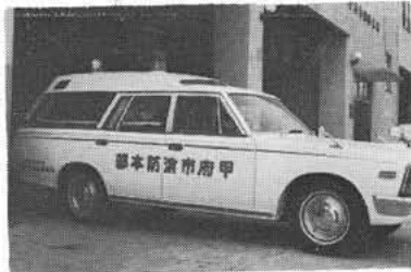
救 急 車

救急車の出動を要請するのには、原則として、日中、夜間を問わず、いつでも役場に電話、その他の方法で連絡してください。役場から甲府市消防本部に連絡します。