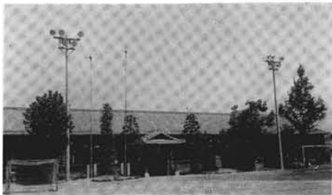
(新設された照明柱)

夏の夜空を真昼のように照らす夜間照明施設が、この六月立派に完成しました。 これは本町の社会体育施設として、県補助を受けて、工事費二百八十三万円で小中学校庭に設置されました。 高さ十五メートルの本の柱に、一キロワットの水銀灯五個づつ、三十キロワットの照明灯が、まるで後樂園のように明るくしてくれます。