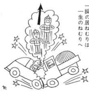
(昭和町交通事故発生状況・昭和45年中)

別表は昭和四十五年度の昭和町における交通事故の状況です。発生事故の割合は県下で第二十五位ですが、飲酒運転で住民の起した事故は山梨県は全国第二位で、昭和町は県下第一位の汚名を残して