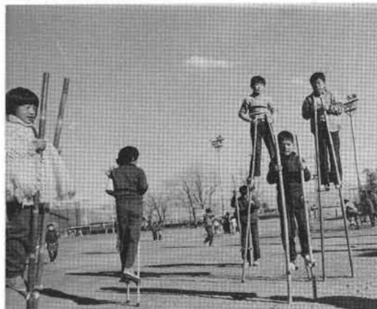
—高・低それぞれの竹馬乗り—