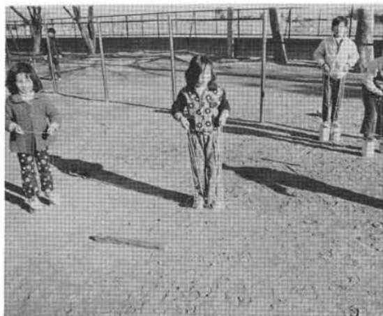
—空かんで作ったパッカリン—