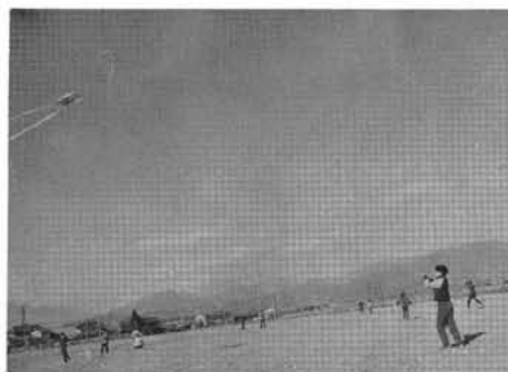
—自分の名前を書いて……たこ上げ—

一月十七日、押原小学校では一年生から六年生全員に、冬休みの宿題の一つで、竹馬、たこ、弓矢、パッカリン、はこ板を自分で作り発表会を行いました。この目的は、最近の遊びのなかには、時代の発達ですばらしい完成品が多く、自分の力で考え、作ろうとする事に欠けるため、それぞれの考えで、いろいろな形で作ってもらいました。この日は、いろいろの作品を持ちより、たこ上げは押原中学校(予定地)で、そのほかは、小中学校々庭で発表会を行いました。