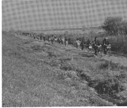
釜無サイクリングロードでサイクリングを楽しむ若竹子供クラブのなかまたち