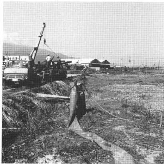
町 道 ・ 昭 和 玉 穂 線