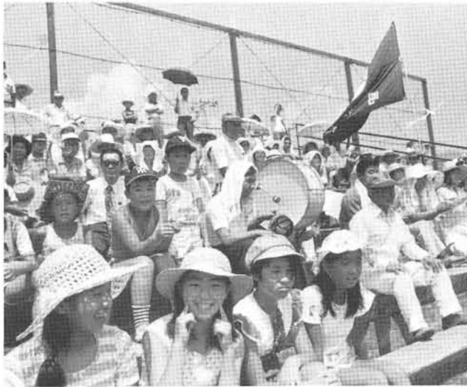
大勢の応援を集めたスポーツ少年野球チーム (緑ヶ丘球場で)

今年の夏も連日三十度をこえる暑さがつづき、社会体育行事も炎天下の中で、体力づくりと親睦を目的に盛大にくりひろげられ部落対抗球技大会は各種目に熱戦が見られ、最近急激に人口の増えた上河東阿原、西条一区などの善戦が見られ、例年にない接戦が多く大会関係者や応援の人たちの注目を集めていました。