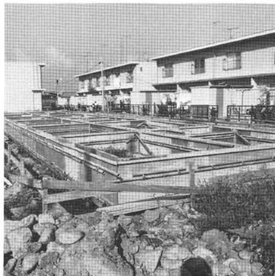
町 営 住 宅 建 設