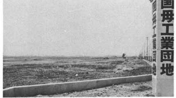
国母工業団地(紙漉阿原)