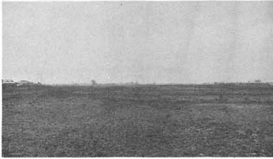
釜無工業団地(築地新居)