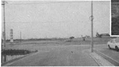
医大取付道路 7千5000千円