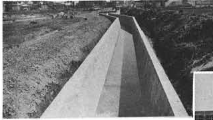
地方病溝渠 3千0601千円