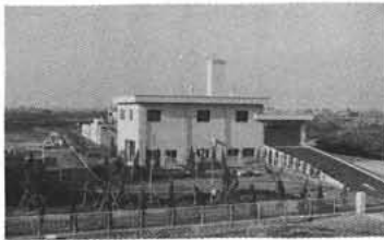
峡中衛生センター (中巨摩広域事務組合) 2千5251千円