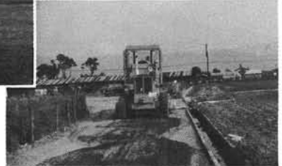
町単土木事業 5千0601千円