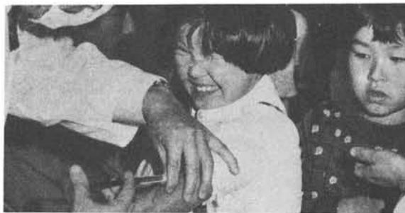
以上が大安ですが詳細については住民課に連絡して下さい。