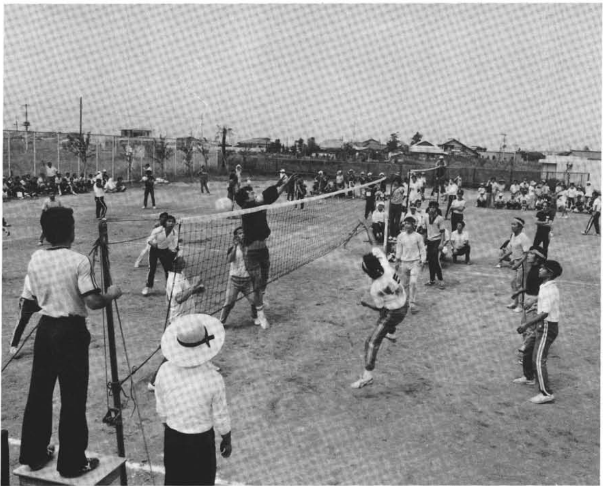
随所に好プレーの見られた部落別対抗バレーボール大会