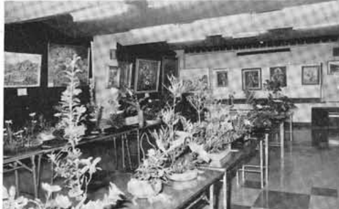
展示会場もすばらしい作品でいっぱい