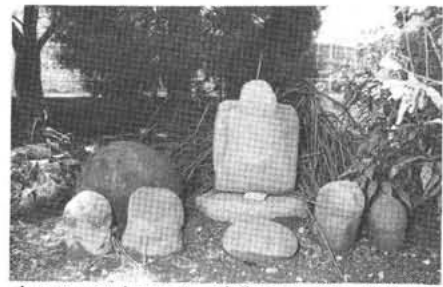
今は訪れる人もなく、安住の地を得た地蔵さま

「お地蔵様は地蔵菩薩と申し上げます。そのお名前は大地のごとく忍耐強く寛容で、静慮を