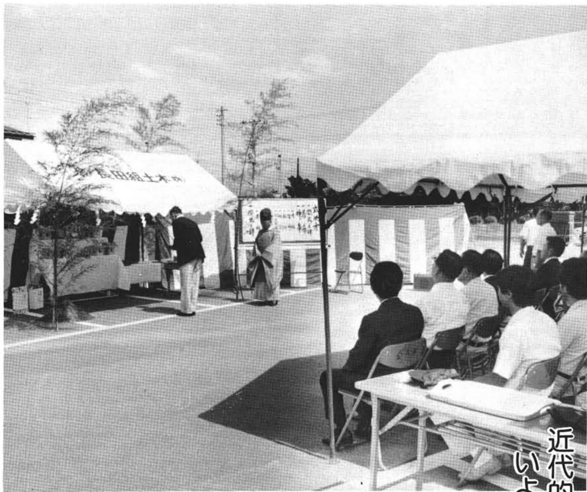
玉串奉典を行い工事の安全を祈願する