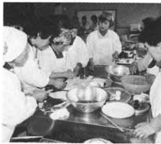
真剣な目つきで実習に望む

「ボランティアの意味、心は何だかむずかしかったが、自分だけで考えず、話し合うことにより主旨がわかってきた」など、ボランティアに対する認識を深めてきたようで、これから先大きな成果が期待されます。