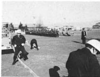
みごとなポンプ車操作法を披露

新春恒例の出初め式を快晴に恵まれた一月四日、午前十時押小校庭で盛大に挙行しました。