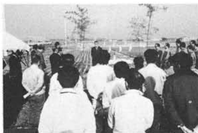
1月10日の二期工事起工式

残る町内路線はすでに調印が済んでいるところから、遂次工事着工されてゆき、五十六年中央道完成までには全線の開通が予定されます。