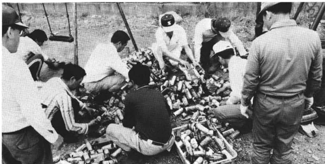
集めた空きかんを分別する西条二区のみなさん