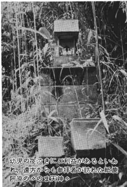
幼児の夜泣きにご利益があるといわれ、遠方からも参拝者が訪れた紙漣阿原ののま天神

参考文献一昭和村誌、甲斐国志、角川書店地名の語源、新人物往来社日本地名語源事典、平凡社世界大百科事典、甲斐地名考（佐藤八郎氏著）岩波国語事典。