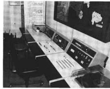
災害通報、行政情報が的確に放送される防災行政無線心臓部