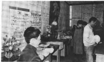
すばらしい作品の数々 押中学園祭