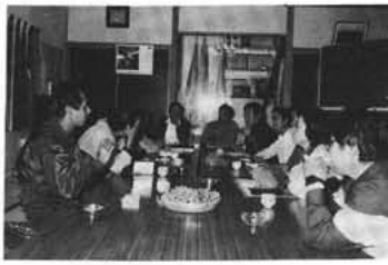
熱心な話し合いをしている 推進委員

▼保険証はだいじにつかいますよ。 国保でお医者さんにかかるときは保険証を持参して診療を受ける