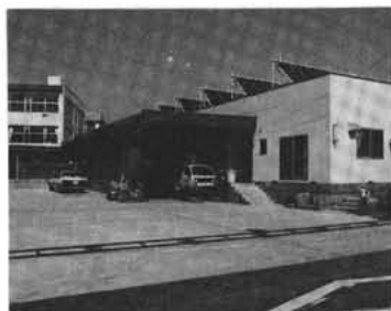
永年の懸案であった 共同調理場

衛生費は衛生費の主たる事業は、風土病対策の地方病溝まじコンクリート化事業があります。当該年度から新設は終了、破損溝まじの改修工事に切り替えられ、その工事の施工延長は二、九八〇メートル五、九〇二万円を支出しました。また、組合運営しているゴミ、し尿の処理負担金は、三、一三九万円です。 この他、町民のみなさんの健康管理指導をおすすめするため各種検診を実施、病気の早期発見に努めました。 公債費は町がいろいろな事業をするため国や県から借り入れたお金の返済で今年度返済額は一億二、六四七万円です。昨年より八・八割増となりました。 この返済事業の主なもの、庁舎を始め、町営住宅、都市下水路、町民体育館などです。 消防費は防災行政無線の設置を始め防火水槽を町民体育館前に設置しました。 この他、消火栓標識の設置、小型動力ポンプ、発電機なども購入し、いざというときに備えましました。 農林水産費は農林水産業費では、農業の経営安定を図るため積極的な事業が進められました。