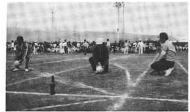
知事もハッスル 「ピンたおし」

昭和町周辺の町村の利用者が増加しないと、バス会社も甲府昭和インターからの乗り入れをしないようです。そこで、今後高速バス予約については、自宅の電話で予約していただき、一日も早く、一本でも多くのバスが甲府昭和インターから乗り入れられをよう、バス会社へ要望してゆきたいと思っておりますので、町民の皆さんのご協力をお願いいたします。