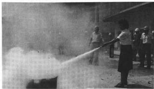
中央公民館前での 防災訓練(昨年)

大正十二年九月一日の関東大震災にちなんで昭和三十五年に設けられたもので、災害についての認識を深め常にその心構えを怠ることなく、いざという時に備えようというものです。 町では、大規模地震が東海地域に発生するとこの想定のもとに、昭和町地域防災計画に基づき実践的な訓練を九月一日に行いますのでご協力をお願いします。