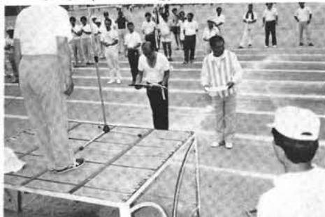
賞状・楯を授与された団長・副団長

総合優勝は竜王町、準優勝には本町と接戦のうえ白根町、本町は惜しくも三位に終わりましたが、目標の三位入賞を果たしました。