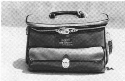
寄贈された救急カバン