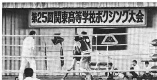
好試合が展開されたボクシング大会