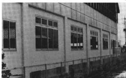
増設した控室（町民体育館北側）

控室等の増設も終わり、日体協総合視察での「ボクシング会場としてはまれにみる素晴らしい」という評価は、この関東ボクシング大会で実証され、また