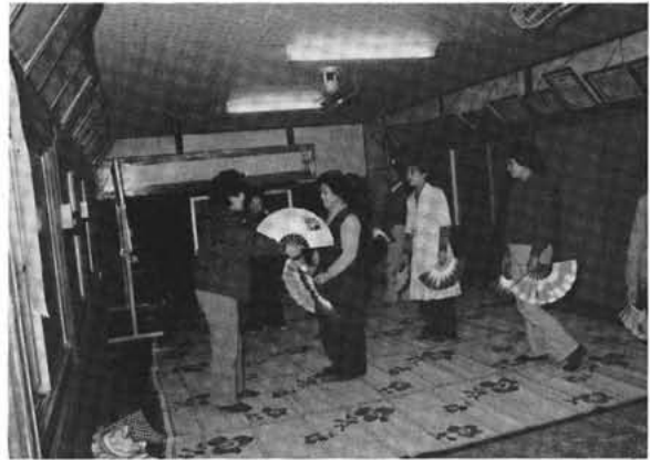
民謡教室 (公会堂にて)

清水新居区では、昨年区長が交替したばかりの時に、町からふるさとづくりを推進するようにとの依頼があり、どんなことをしようかと思案し組長会議にはかった結果、各部でふるさとづくり学級を取り入れ、運営の組織図をつくり実践に入ったそうです。