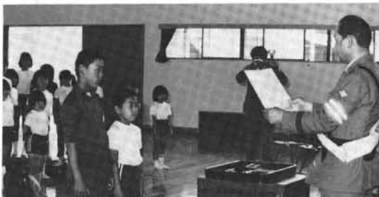
感謝状を授与された若竹子どもクラブ