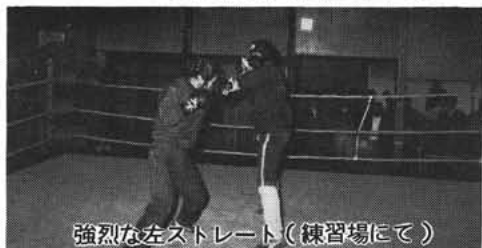
強烈な左ストレート(練習場にて)

なお、この練習場は県アマチュアボクシング連盟に許可を得ると一般の方々も使用できます。詳しいことは、教育委員会へ問合せ下さい。