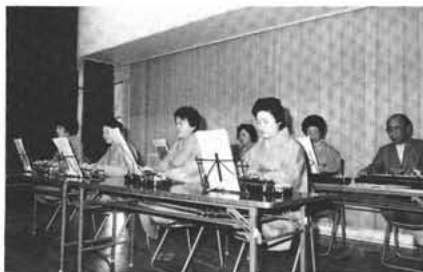
自慢の大正琴も披露

ご協力をいただき、ありがとうございました。募金の総額は、786,948円で、内訳は次のとおりです。戸別募金 333,091円、大口募金 203,000円、街頭募金その他 250,857円、以上の内、10,000円以上の拠出者は、大松工業㈱、深川屋商店㈱、岡島ファミリコ、よっちゃん食品㈱、釜無金属工業協同組合、名執組、品川工事㈱、の七企業でした。