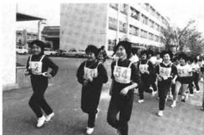
行きはよいよい、帰りは・・・