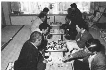
なかなか手ごわいなあー