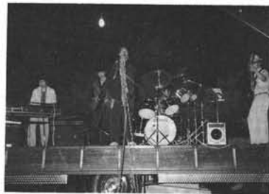
青春をロックに向けて

音楽を愛好する高友バンドグループは、バンドの練習をかさね社会参加活動として地域の夏祭り等で発表した勇氣と努力が認められ、十一月二十五日山梨県高等学校PTA指導者、生活指導員中央研究会で表彰されました。