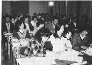
熱心に学ぶ受講生

九月から十一回にわたって開催されていた手話講習会が、十一月十五日をもって修了しました。