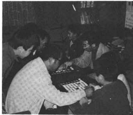
オセロゲームでふれ合いを

人と人とのふれあいをいっそう深め、楽しみながら学習を実践しようとして上河東では、社会教育委員、区役員及び諸団体が推