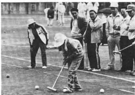
押原小学校々庭にて