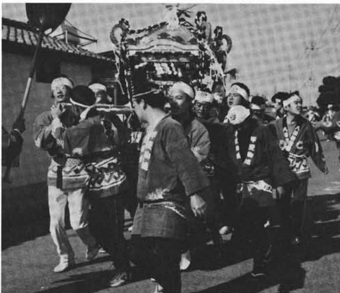
神輿で押越地区内を練り歩いた

十一月三日、文化の日、押越八幡神社において午前八時から祝砲を台図に秋晴れの中、八幡初穂祭が行われました。 上条神官の神事が厳肅の内に区民の弥栄と押越区の発展を祈念し一同神酒で乾杯、九時から区内へ神輿が出発各地域リレー方式で五十名の氏子で東から北・南・西と練り氣勢を上げ祭り気分を最高に盛り上げました。