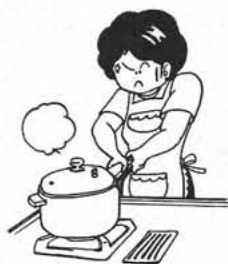
無理に開けないで!

圧力なべが人気をあつめていますが、普通のなべとちがってなべの気圧があがるので取扱いを誤ると危険です。