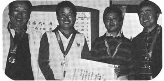
団体の部で優勝した河東中島チーム