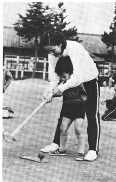
グランドゴルフを行っている。じょうずに打てるかな！（押原小学校々庭にて）

をさがすスクールオリエンテーリングにと親子そろって快い汗を流した楽しいひと時を過ごしておりました。次回は、二月九日（土）読書広場（ゲーム、かみしばい、絵本の読み聞かせなど）を行う予定です。