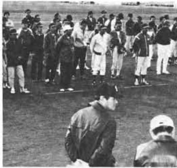
開会式が行われた（押原中学校々庭にて）