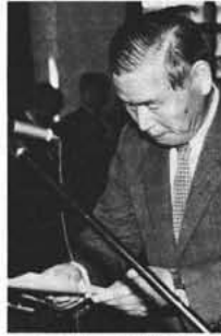
受領状の交付を受ける審議会委員

原中学校及び西条小学校々舎、プールの建設、学校給食共同調理場の建設、県立高等学校誘致を実現のための中央公民館、大型体育館を建設し、広域事業として甲府地区広域市町村圏、峡中衛生組合、中巨摩地区広域事務組合を設定し、ゴミ処理場、し尿処理場を建設し消防体制の強化を図るべく甲府地区広域常備消防を設置し、また、医療問題に熱意を示し、郡町村会役員として休日、夜間診療、予防