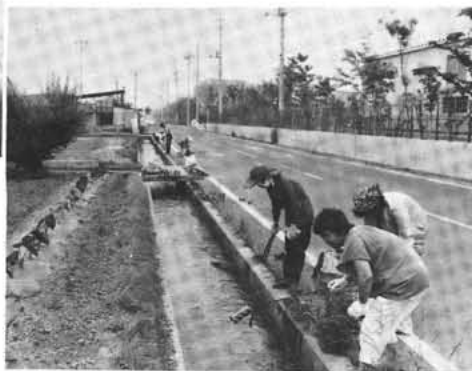
釜無工業団地周辺の河川にて