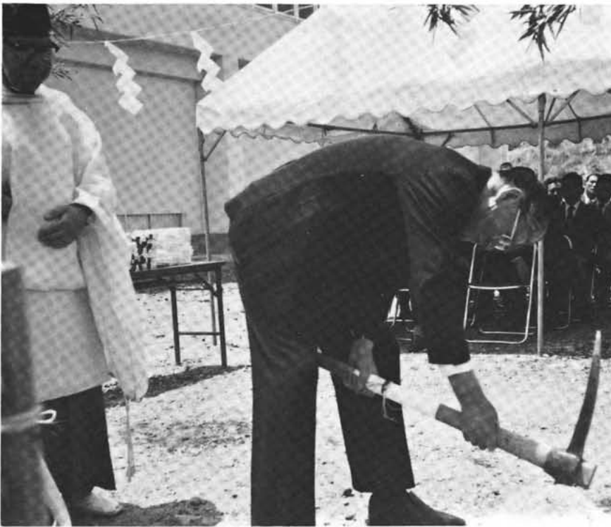
5月14日西条小学校敷地内で起工式が行われた

見込んでおります。 プールは、二十五メートル七〇メートル、低学年用(五十平方メートル)をとり、他に男女更衣室、管理室、シャワー室、便所、機械室なども併設する。