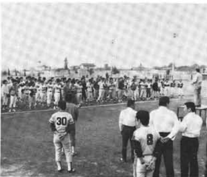
押原中学校々庭で開会式が行われました