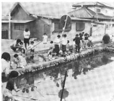
築地新居 御水神(池)にて

築地新居育成会では、去る六月三日(日)築地御水神(池)に於いて子どもマス釣り大会を開催いたしました。これは次代を担う子ども達を健全に育成しようとする恒例行事となっているもので、子どもクラブの会員が対象、小さい子どもには親も手伝って盛んに釣を楽しんでおりました。