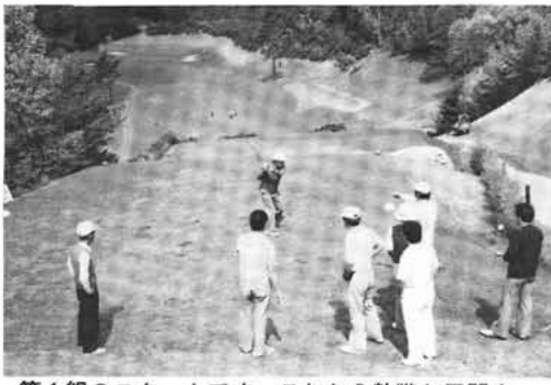
第1組のスタートです。これから熱戦が展開されました