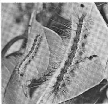
終令(7令) 幼虫による被害

なお、病虫害発生予察情報の提供(テレホンサービス・三三二一八三三三)を行っております。