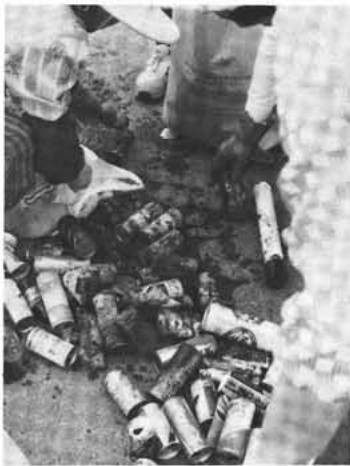
空き缶や空きビンなどを捨てないで下さい

この作業で空き缶九六四二一個、空きビン二〇八八三本を拾い昨年をはるかに上回り、環境美化がこれだけ騒がれているにもかかわらず参加したみなさんはこのようすを見て「一人一人がもっと環境美化に対する認識が必要だ」と口ぐちに話しておりました。 なお、空き缶の処理代金一六、〇〇〇円は、町社会福祉協議会へ寄付させていただきます。