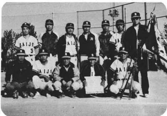
投打にバランスのとれた西二

★申込期限 。開会式及び閉会式 昭和六十一年十二月一〇日 。スピードスケート競技会及びフィギュア競技会 昭和六十一年一月二十二日