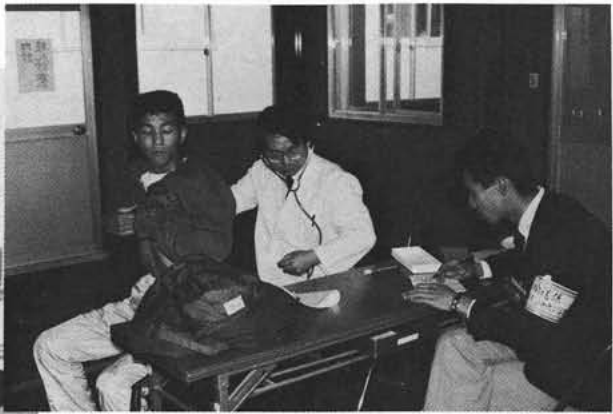
▲ 選手の安全管理に関係者もビリビリ