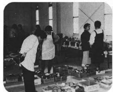
大人気の農産物即売会