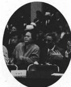
楡山選手の御両親も熱い声援