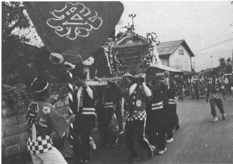
みこしの練り歩きにまつりは最高潮