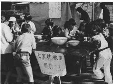
子供達に人気のあった七宝焼