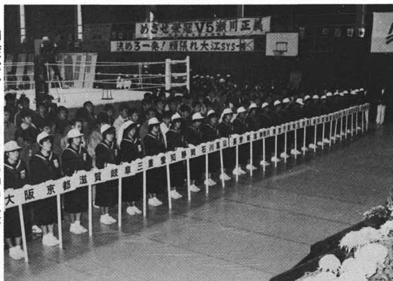
開会式でプラカードをもつ押中生徒

町体育指導員、県アマチュアボクシング連盟関係者、役場職員などが当り激しいスポーツだけに安全管理に真剣に取り組んでいました。今回のリハール大会での成功により、来年の本番に向けて大きく前進し、また自信にもつながっています。