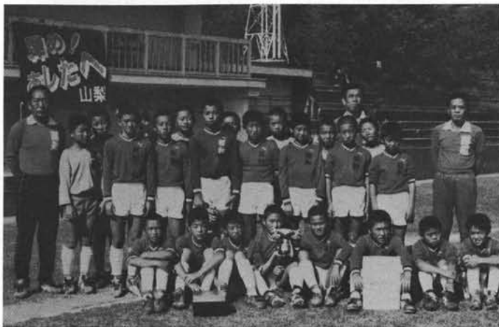
みごと準優勝に輝いた昭和健児たち