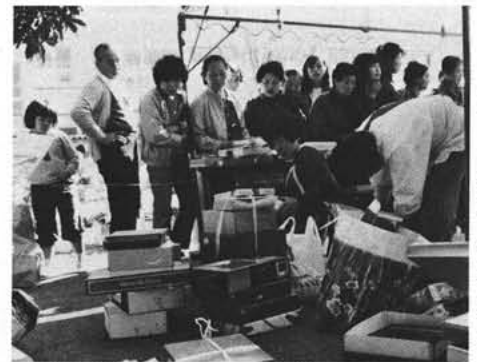
バザーに御婦人が殺到!