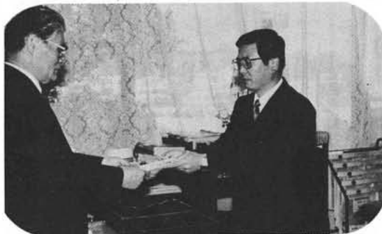
昭和町役場町長室で

日立製作所労働組合甲府支部は支部結成二十周年記念事業として十月二十八日役場町長室を訪れ、社会福祉に役立てて下さいと、二十万円と、学校教育の育成にと、日本地図二十冊を町へ寄付して下さいました。あたたかい善意ありがとうございました。