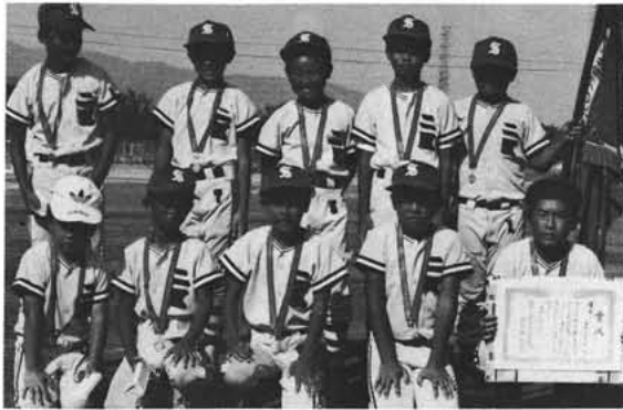
ソフトボールに優勝した 西条二区Aチーム

健全なスポーツ活動を通じて子どもへの体力増進をはかるとともに汗を流す中で子どもクラブ相互の親睦を深めることを目的に、第十五回昭和町子どもクラブ球技大会(主催・子どもクラブ指導者連絡協議会)が八月四日、猛暑の中で男子ソフト十四チーム、女子バレー十三チームの参加によりそれぞれ熱戦が繰り広げられました。