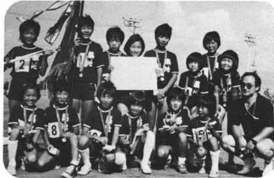
バレーボールに優勝を飾った築地新居チーム