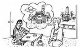
山梨の歴史・文化財・観光地を知っておきましょう。

菓子類のみやげは種類も多く、どこの県にいても同じようなものばかりであるが月の雫は、甲州独自の味をもち、しかも伝統のある菓子である。今から二五〇年前の享保年間、甲府市八日町の牡丹亭主人が菓子を作るため砂糖を煮つめていたところ棚の上に置いたぶどうが鍋の中に落ちて、砂糖に包まれてしまった。これを食べた主人はその珍味におどろいて、生産したというの、この銘菓の誕生生活である。