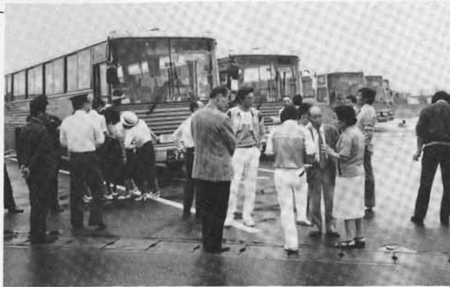
「さあ出発」バス五台 総員二三〇名の大移動

参加した老人たちは、これが何よりの楽しみにしている方もおり、旅行好きのおとしゆりにおおいに喜ばれていました。