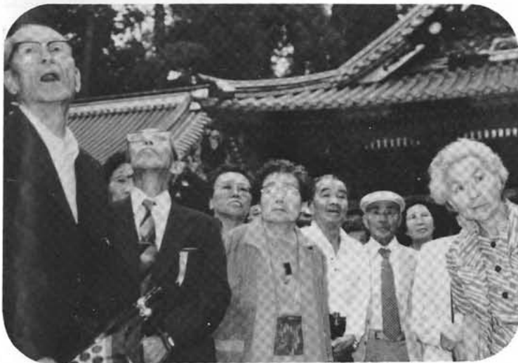
ほう…これがね～(日光東照宮で)