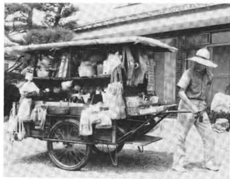
チリン・チリン…… 今は、ただ一人のなんでも屋 のおじさん(78才)