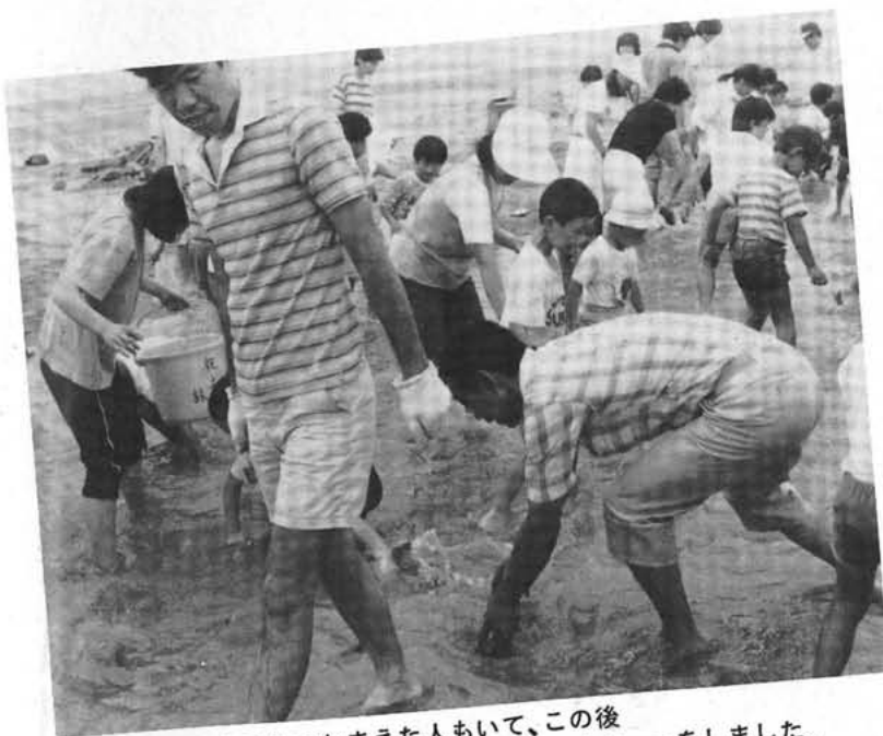
1人で20匹もつかまえた人もいて、この後みんなで河原でバーベキューをしました。

びのび楽しく青空の下で過ごしました。次回は、九月八日(日)野山を歩こう(武田の森遊歩道)、十月十三日(日)オリエンテーリング(宝さがし)、六十一年二月十五日(日)読書広場(えほんの読みきかせ、ゲーム、かみしばい)などを計画しています。きっと親子のよい思い出になるでしょう。