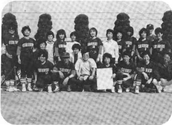
優勝した押越チームのみなさん

第五回町内地区対抗ママさんソフトボール大会(主催・町ソフトボール連盟)は、六月十六日(日)押原小学校グラウンドにおいて、参加十チームによって熱戦が展開されました。