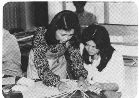
藤細工教室(公民館講義室)

町の中央公民館では、生涯学習の一環として、藤細工教室・七宝焼教室・書道教室を大勢の参加者を集め、五月十四日からそれぞれの教室ごとに五回にわたり開催しました。