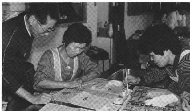
七宝焼教室(公民館調理室)