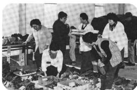
▲丹精こめて作られた農作物がずらりと並べられた