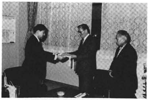
町長室で国体旗の引き継ぎが行われた

これは、国体会場となった市町村の代表が二年後に同じ種目を開催する市町村を訪問する恒例の行事となっているもので、国体旗を引き継いで「かいじ国体」が近づいて来ていることを実感した。