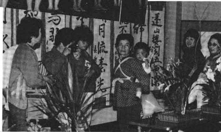
▲力作が展示された(中央公民館にて)