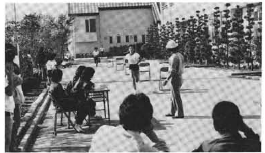
何番かな? (押中校舎前にて)