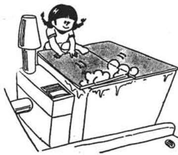
ふろふたに手をついたり上にのったりしないで！

家族がひとつふろにはいる日本の入浴習慣では「ふろふた」が必需品です。しかし、ふろふたのかかわりあいでの事故が起こっています。