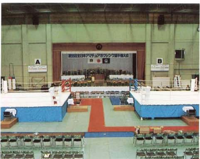
リハーサル大会より(町民体育館)