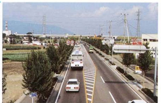
整備された都市計画道路 「昭和バイパス」

更に意見、要望等を取り入れながら、二十一世紀へ向けて活力あるよりよいまちづくりを進めてゆきます。