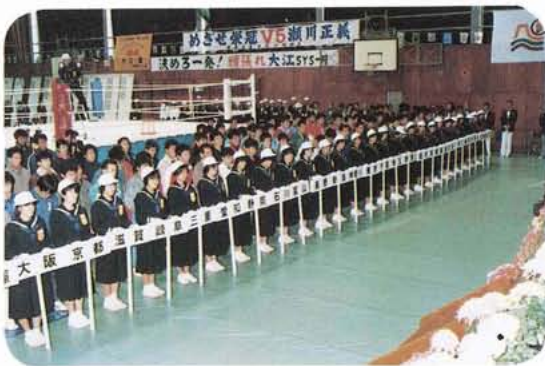
リハーサル大会より(町民体育館)

十月十三日(月)から十月十七日(金)までの国体期間中、役場は戸籍窓口事務以外の全職員が、国体業務に従事します。町民のみなさんには、その間何かとご不便をおかけしますが、町民のみなさんのご理解とご協力をお願いします。