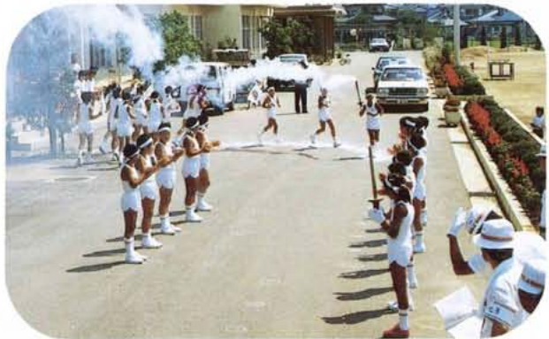
8月8日に行われたリハーサル(西条小前)

「ごくろうさまでした」「よろしくお願いします」——かいじ国体の大会旗・炬火リレーが、十月十日午前九時三十分〜十一時三十分まで町内各地区を町内児童、生徒の手によってリレーされます。 本番ながらに八月八日にリハーサルが行われましたが、ほぼ満点のできばえで、本番への自信を深めました。十月十日の本番には、リレー走者に温かい声援をお願いします。また、リレーコースになっている道路では、リレー隊の走行に支障がないよう、警察官や安協、消防団などの指示に従ってください。また、路上の駐車などはやめましょう。 何かとご迷惑をおかけしますが、よろしくご協力ください。