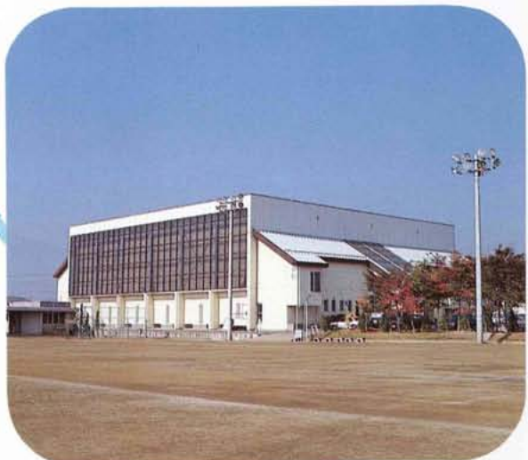
▲ボクシングの競技会場・昭和町立町民体育館