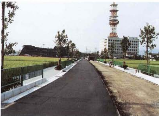
開発進む神屋土地地区画整理