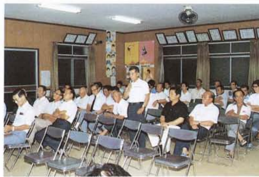
活発な意見・要望が出された 西条一区公会堂

今後、町内各地区を全て巡回して、更にこうした機会を設けて、町と住民とが、手に手を取り合っ