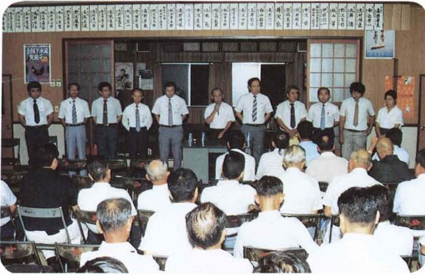
▲町当局と住民との巡回対話集会(西条一区)