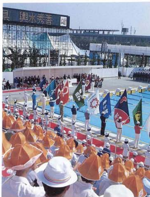
夏季国体開会式 (小瀬)