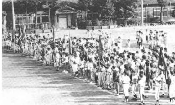
子どもクラブ球技大会開会式(押小)