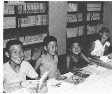
児童館図書室より

ない学校が多いのです。先生に言わせれば、遊んでいればいいとのことですが、先のことを考えると心配な親たちは学習雑誌を買い与えたりして教科の勉強をさせたりします。