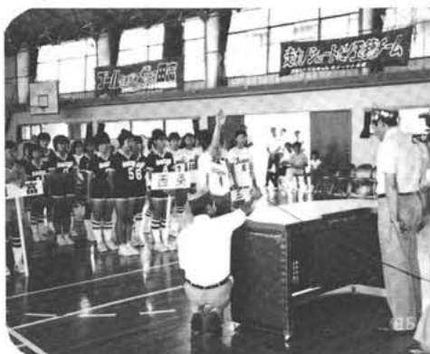
大会選手宣誓する 押小ミニバス

中巨摩郡体育祭りが、七月十三日、二十日と竜王町を主会場に三十四会場において盛大に開催されました。 本町は、競技種目三十一種目のうち二十四種目に参加、このうち弓道（男子）（女子）、バドミントン（男子）、銃剣道、テニス（女子）、クレー射撃、ハンドボールが優勝しました。 総合優勝は、地元竜王町・二位 楡形町・三位敷島町の成績でした。