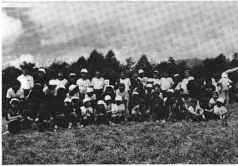
西条一区育成会(夏季キャンプ)

西条一区育成会は、地域が市に隣接していることから近年転入者が増加し子供の急増に加え環境の悪化を心配することから育成会が中心となり地区をあげて青少年の健全育成に取り組み、地区内の道路に立看板を十数本設置し意識の高揚につとめると共に、子供の氏名入り赤旗でドライバーに注意を呼びかけ、またPTA、子供クラブ役員等の協力を得てパトロールを強化するなど地区をあげて事故防止、明るい地区づくりに努めている努力と成果が認められました。