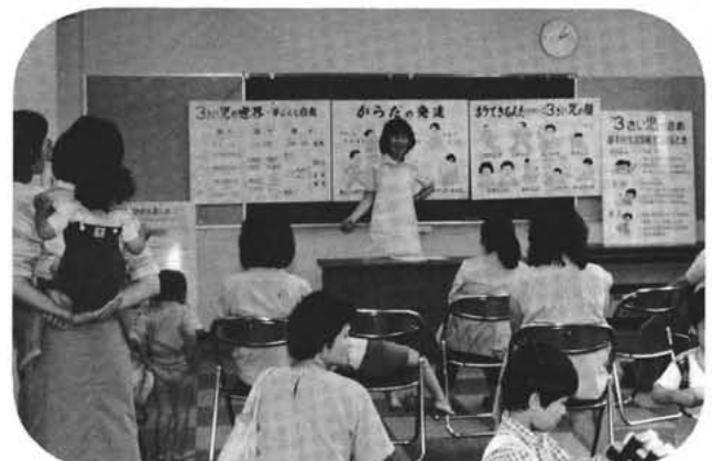
総合会館(保健センターで)