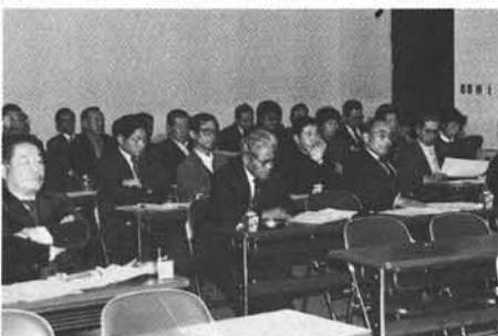
役場大会議室において(青対会議)