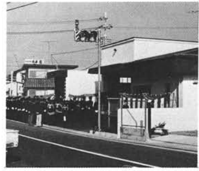
「あとで、より」いま、大切火の始末

町民のかねてよりの望みであった消防署の昭和出張所が押原小学校旧プール跡地にこのほど完成しました。