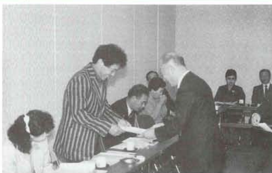
▲泉町長から委嘱状を受ける町政モニターの方々。「住みよい町づくり」のためにご協力をお願いします。

町では、第一次町政モニターの任期満了に伴ない、二十四名の皆さんを新たに委嘱しました。 この制度は、「町民こそ町政の主人公」という考えのもとに昭和六十一年十月からスタート。各地区のモニターの方々から普段感じていることや行政に対する意見など身近な問題を寄せてもらい、これからの町政に反映させていこうと設けられました。これまでに第一次町政モニターの方々のご意見で議場傍聴席の改良や道水路、通学路の改良、中央自動車道側道の街