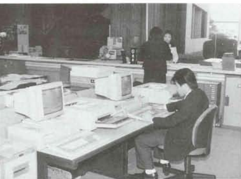
▲コンピュータ導入により、窓口サービスの向上がはかれます。