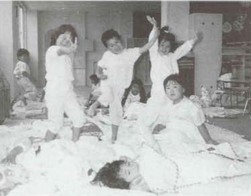
▲みんな元気な良い子で～す! (押原保育園で)