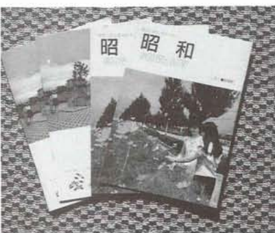
▲完成した町ガイドブック。表紙は、昭和バイパス沿いの「コスモス街道」で飾られています。

まだお手もたない方は、役場 カウンターに備え付けてあります ので、ご自由にお持ちください。