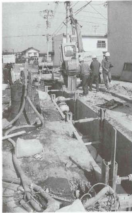
▲自然と生活環境を守ってくれる下水道。現在、工事が急ピッチで進められています。(上河東地区区内)

や海がよごれるのかを話し合ってみることがあります。また、家庭で使われた水がどこへ流れているのかを考えてみたことがありますか。家庭で使われてよごれた水は、川や海に流れていきます。今のように、人がたくさんふえ、たくさんの水が使われ、これが川や海にそのまま流れるとよごれもひどくなり、やがて悪臭を放ったり、魚が住めなくなったりしてしまいます。