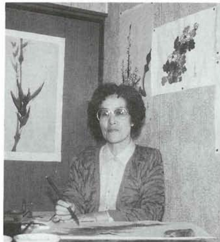
▲「水墨画を通して、心豊かな老後でありたい。」