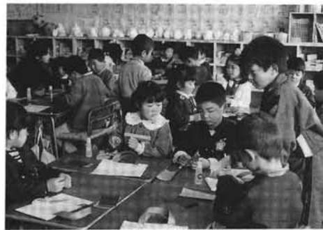
▲両親の温かい心くばりを一。—西条小一日入学で—

幼稚園から小学校へ入学する時期は、子供にとって人生の一つの峠になると思いますが、親も子供も夢と希望を胸に抱いて「入学したらしっかりがんばるのよ」「小学校にいったらしっかりやるぞ」と張りきっています。又、希望と緊張の一方では「大丈夫、できるだろうか」という一抹の不安も消えないのです。