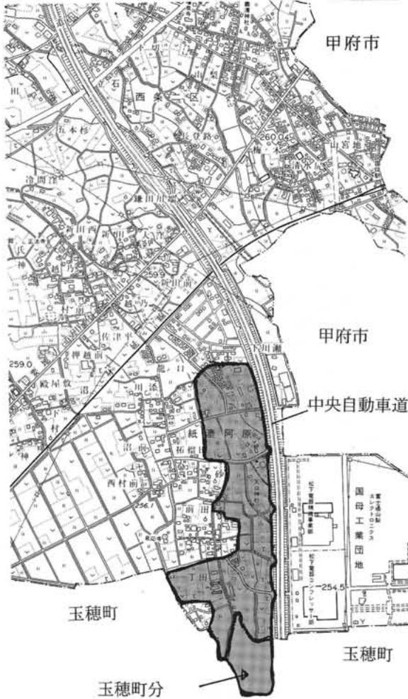
昭和町・玉穂町紙漉阿原土地区画整理事業位置図