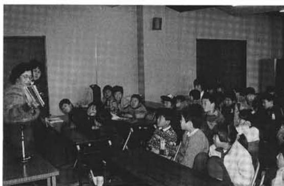
▲本の読み聴かせ—みんな目を輝かせていました。

一坪図書館長連絡会は二月二日、中央公民館講堂で「第六回親子の読書ひろば」を盛大に開きました。 この広場は、人形劇やゲーム・読み聴かせを通して読書に興味をもってもらおうと行われました。 この日は、約一〇〇人の親子が集まり、山梨学院短期大学児童文学研究会の皆さんによる「手袋を買いに」の人形劇や一坪図書館の皆さんと押原小・司書の秋山先生による「ビュンビュンごまがまわったら」「大きなかぶ」「キャベツくん」などの本の読み聴かせが