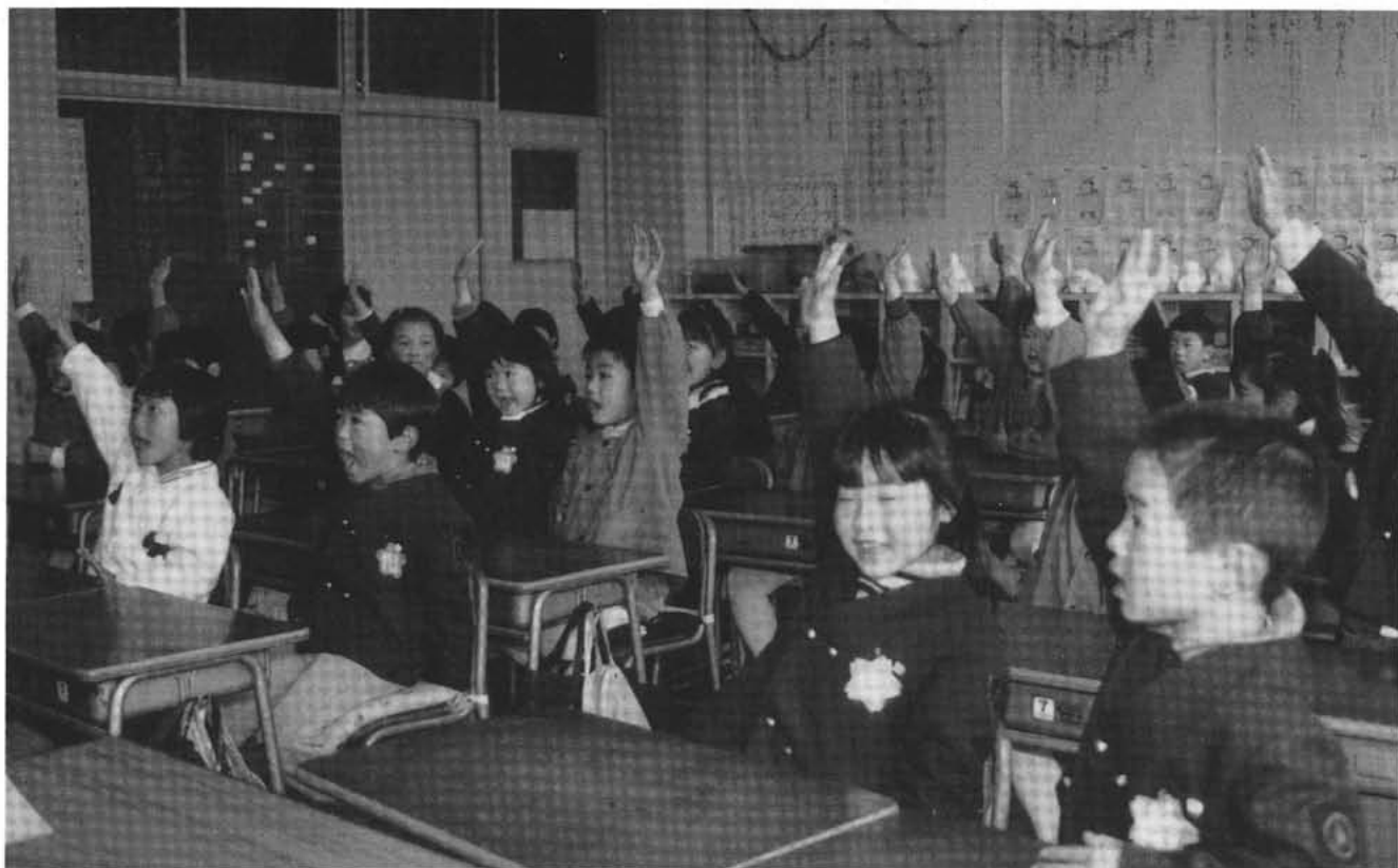
—西条小学校一日入学で—