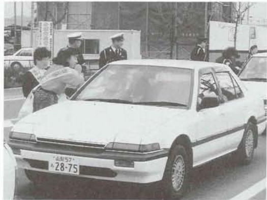
▶道ゆく車に風船やチラシを配布し、交通安全を呼びかけました。