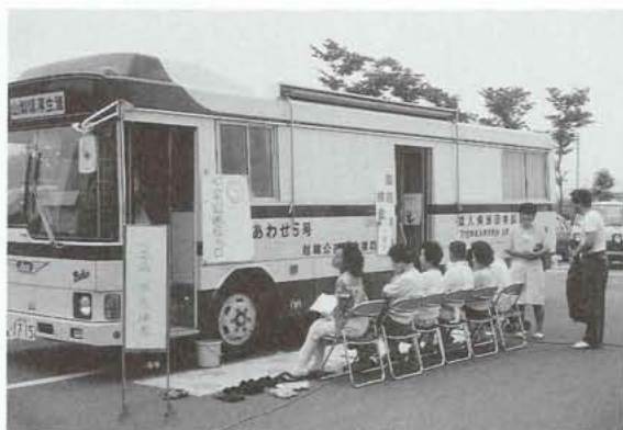
▶無料で各種健康診査が受けられますので、この機会にぜひお申込みを！