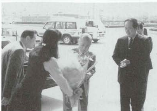
◀ 職員の出迎えを受け、再選後、初登庁。

今、昭和町をはじめ各町村は、二十一世紀に向けて大きく変貌しようとしています。リニアモーター