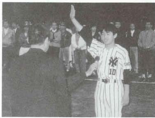
▲リーグ戦の開幕を告げるYNクラブAチーム原主将の力強い選手宣誓。

第八回を迎える今年から参加チームが二十五チームと増えたため三リーグ制を採用。A級リーグ八チーム、B級リーグ八チーム、C級リーグ九チームによって十月ごろまで熱戦が繰り広げられます。果たして、今年の秋にどのチームが優勝旗を手にするのでしょうか。