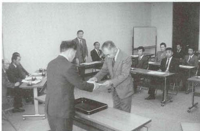
▶農政の諸問題に活躍が期待される新農業委員の方々。一人ひとりに当選証書が手渡されました。