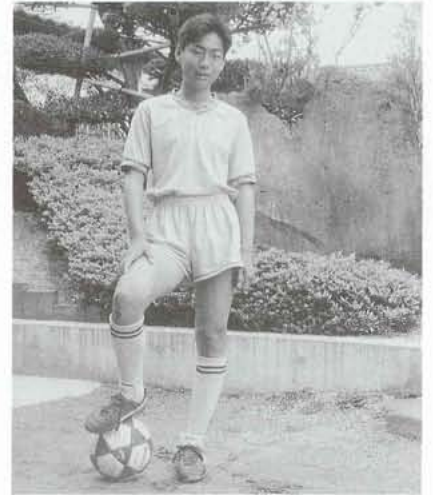
▲「チーム一丸となって、大きな目標に向かって一生懸命練習しています」