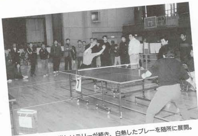
▲激しいラリーが続き、白熱したプレーを随所に展開。

今年で三十回目を迎える町地区対抗卓球大会（町体育協会主催）が三月四日、町民体育館で盛大に開催されました。