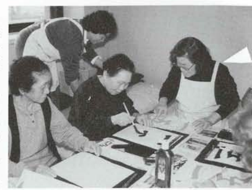
▲れんげ教室で書道を習うお年寄り達。このほか、切り絵や歌をうたったり、温泉に入り一日楽しく過ごしています。

総合会館の約三十畳の専用室では、お年寄り達が一緒に食事をしたり、入浴したり、歌をうたったりして一日楽しく過ごしています。お年寄りのみなさん、とても楽しいところですので、参加してみませんか。一体験入学も歓迎しますので一度おいでください。れんげ教室についてのお問合せは、役場厚生福祉課(☎75-2111 内線⑩) または、町社会福祉協議会(☎75-6461)までご連絡ください。