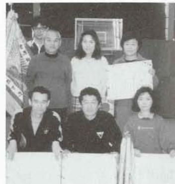
▲3連覇を成し遂げた清水新居チーム。