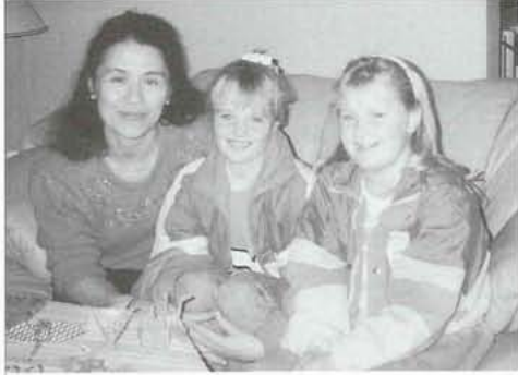
▲ホームステイ先の子供達と（オスロで）

スイスのジュネーブでは、国連保健機構本部・国際労働機関・ロマンダ消費者団体・ノートルダム老人ホーム、ベルンでは、ベルン市労働局・婦人団体センターを訪問しました。ノルウェーのオスロでは、生涯教育施設・身体障害者協会本部を訪問し、さらに、二泊の家庭滞在をさせていただきました。