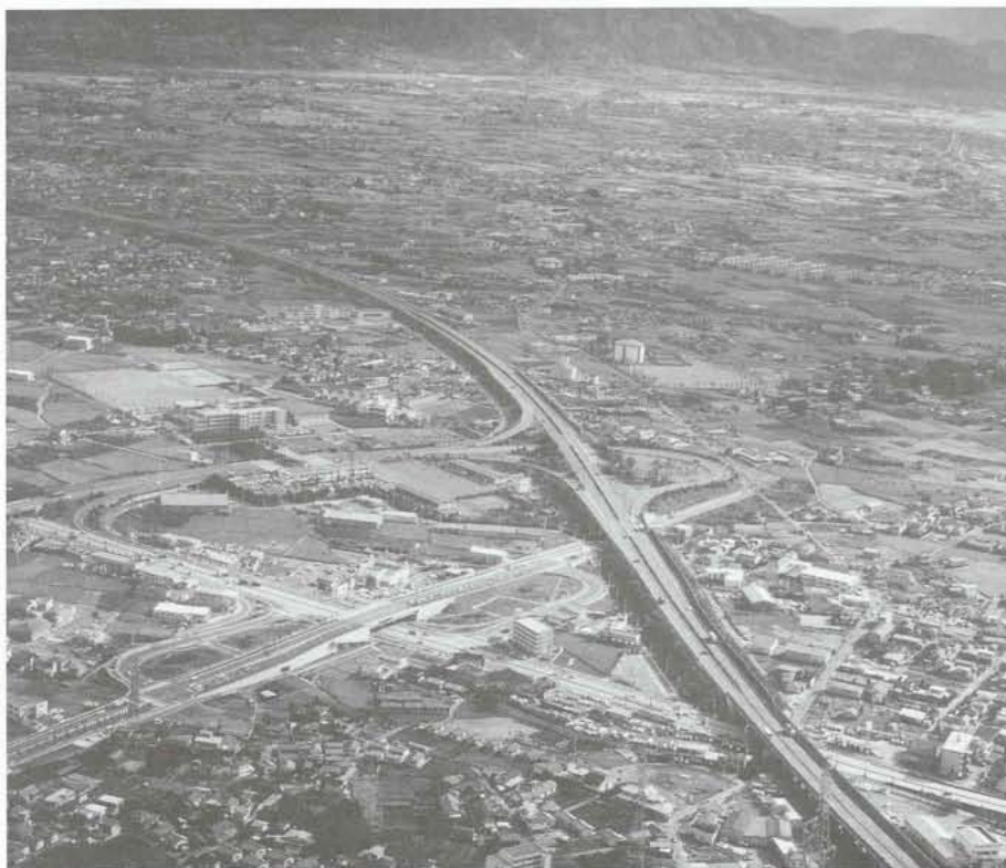
▲ 中央自動車道 甲府・昭和インターチェンジ上空。