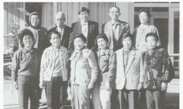
▶今年も一味違った角度から、風刺や二一クな句をお願いします。(川柳部)