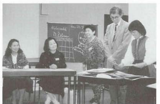
▲成人学校で生涯学習について研修（ミュンヘンで）