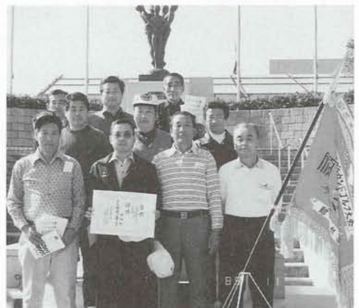
▲ホールインワンも6回記録し、見事「県下一」に輝いた昭和町チーム。

第二回山梨県グラウンド・ゴルフ選手権大会が十一月五日、白根町中央公園グラウンドで開催され、本町のグラウンド・ゴルフ部が昨年に引き続き、二年連続優勝を果たしました。