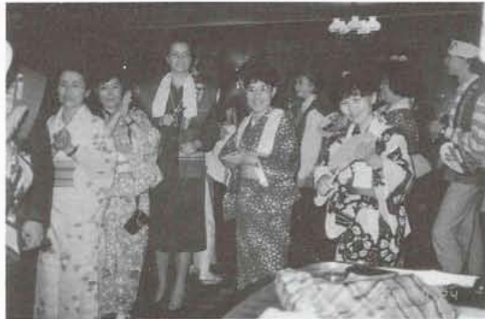
▲ホームステイ家族との交流会（オスロで）

外国人の家庭に入って一緒に生活しましたが、習慣の違いに戸惑い、また言葉の不自由にいらだちを感じながらも、非常に貴重な経験をして来ました。多くの研修の中から特に福祉国家ノルウェーの最近の様子をお話したいと思います。