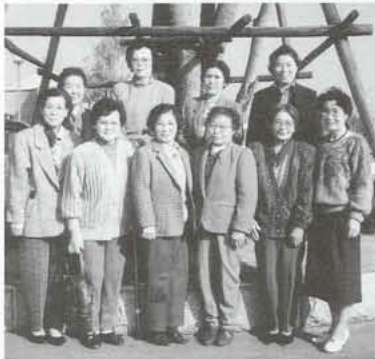
▲豊かな心を17文字にひめて…… 今年もよろしくお願ひします。(俳句部)

熱きほど百円玉にぎりしめ 屋台をば行きつ戻りつ子は覗きこむ 声張りてあそびの歌を合唱し 別れ迫りてしはし照せり 裏庭の豚舎に小豚飼ひし夢 昨日の如くはつらうと覚む 帰省の日知らず電話を朝の日の 紫苑の窓に心待ちする 滝の下小暗く耕理遊ばせて 新田館の狭き空間 万緑の森に師の句碑たずぬれば せせらぎ優し笛吹の川 想い出の歌呼で送る村人に 決意誓いし石段低し 薄曇色に今置れんとす くつろげる宴の席になまはげが 入りきて写す男鹿の旅の夜 実りうすき農となりたり此の頃は 広き耕地に老の荷重く 十年の歴史を歩む新能 富士の社で羽衣を観る 紫蘇は実になりゆく畑に草取れば 時折風が匂い運び来 姿勢には足腰基本ままならず 円舞のワルツ夢の遠かり うそ寒き待合室に検査待つ 或いはもの読み或いは眠を閉ず 夫と子の打ちこむ水魚ねきぎむ 夜の厨に伝わりて来る 生涯を牛改良にかけし夫 丸き背を向け顔洗いおり いさかのこにたたる吾が心 うとましく思いつ草引きそわり