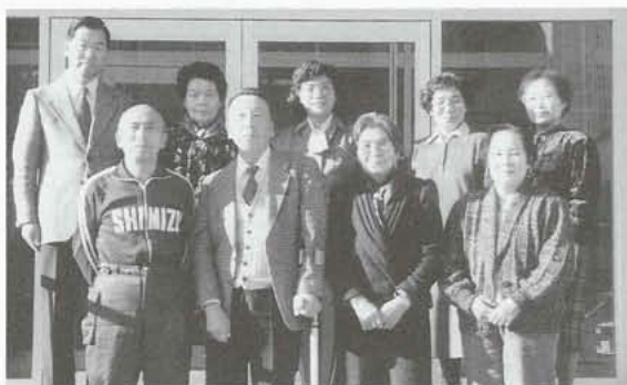
▶喜怒哀楽を和歌に託し、文化の里にふさわしい感動の句を今年もお願ひします。(短歌部)