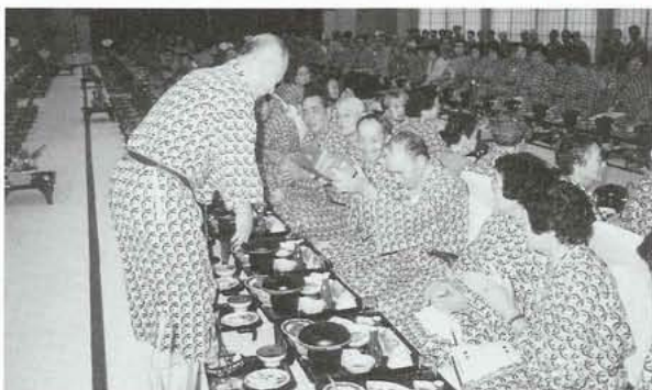
▲ 夜の懇親会では88才以上の参加者に記念品が贈られました。