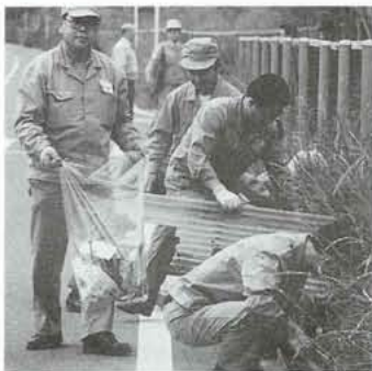
▲松下電器では社員800名が作業を行いました。