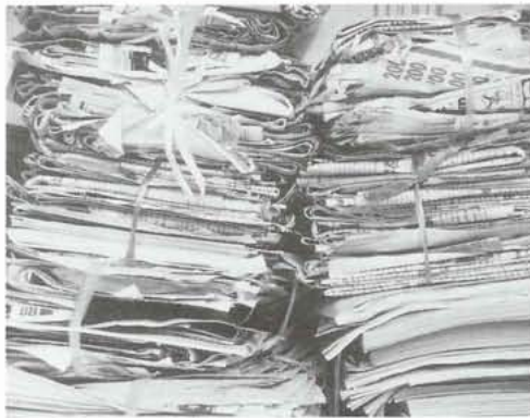
▶新聞・雑誌・ダンボールなどは縛って出してください。

また、社会福祉協議会では、町内の商店・企業などで必要なくなったダンボールが大量にある場合、電話で連絡をいただければ回収に伺う予定です。ご協力いただける商店・企業がありましたら、町社会福祉協議会まで連絡をお願いします。 詳しくは、町社会福祉協議会 ☎75-6461までお問合せください。