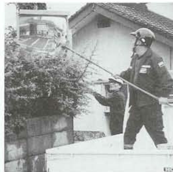
▲この輝きが町の交通を守ります。

「ゴミ0の日」推進事業の一環として、五月下旬から六月上旬にかけて、各地区及び釜無・国母両工業団地を中心とした町内各企業で、空きカンなどのゴミ収集作業を中心とした環境美化活動が実施されました。 各地区では、早朝から区民総参加で、ビニール袋片手に道路や河川に落ちていた空きカンなどを一つひとつ拾い歩きました。 この結果、空きカンおよそ九万五千個のほか、空きビン・ごみなどを収集、大変な成果を上げました。 みなさん、ご協力ありがとうございました。