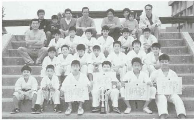
▲全員でがんばった昭和空手クラブのメンバー