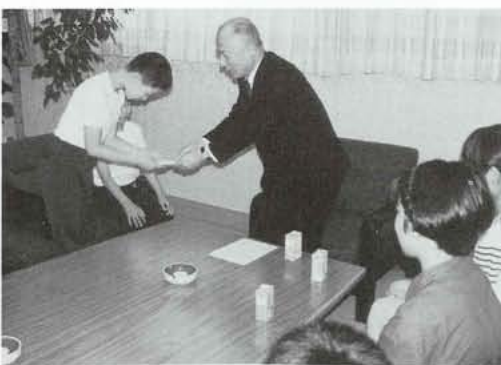
▲ 子どもたちの代表13名が町長室を訪れました。

ひろい」が行われました。子どもたちが、学校の帰りに、袋を片手に通学路付近に落ちている空きカンを拾い集め、それを持ち寄りました。七月二日には町長室を訪れ、この空きカンひろいによる収益金を、「福祉のために使ってください」と泉町長に手渡しました。