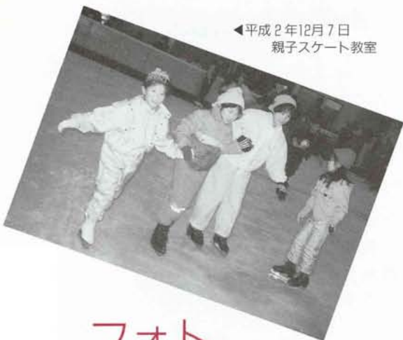
◀平成2年12月7日 親子スケート教室