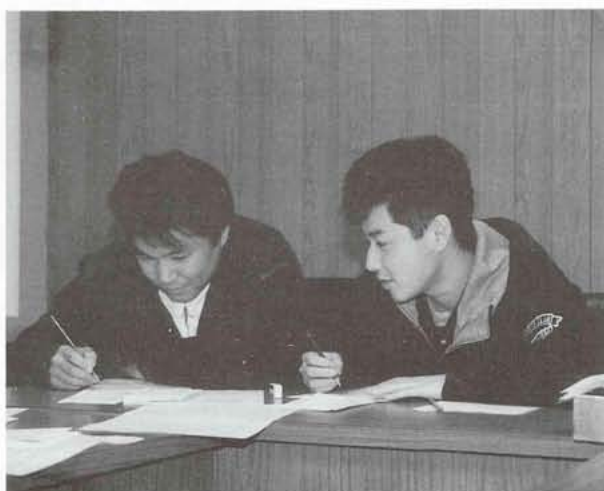
▶数少ない男性軍も、記念の文集に間違いないように丹念にチェック。