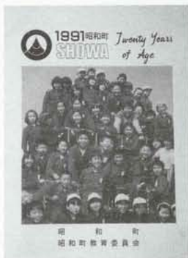
▶表紙は、自分達が小学校四年生の時の写真。

暮れもおし寄せました十二月二十六日。いよいよ文集づくりです。成人代表者のあいさつ・恩師の言葉を電話でお願いしたり、送られてきた「二十歳の一言」を編集するのに大忙し。夜も更けるまで作業しました。