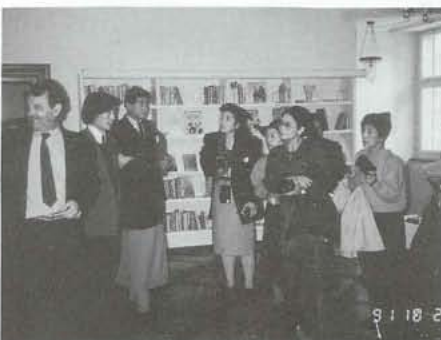
▲ イギリスの成人学校で研修

をお聞きし、私立のモーリーカレッジを見学しました。この方針はすべての人に平等な機会を与える事であり、山梨の成人学校とは少し違い、中途退学者及び大学進学の為の準備の場と成人教育があります。成人教育には趣味的なもの（有料）と職業訓練的なもの（無料で国と県が負担）があり、年齢、人種を問わず年金受給者や失業保険を受けながらも学校に行けます。そして再就職の為の訓練の場でもあり、専門家の指導による芸術教育などが生涯教育として体系づけられている事には大いに興味を感じました。