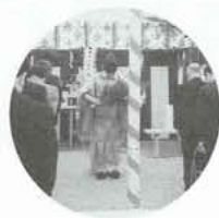
安全を祈願して(温水プール)