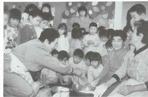
▲ やっぱおばあちゃんは上手だね！

押原保育園では、お年寄りとおじいちゃんとの交流をより一層深めようと、今年の十一月十四日、「ふれあい広場」と題した交流会を催しました。この日は、押原地区のお年寄り三十名が園を訪れ、子どもたちにもほうとうづくりを披露。粉を練って作られたほうとうが、大きく、のされた後包丁で切られた時には、