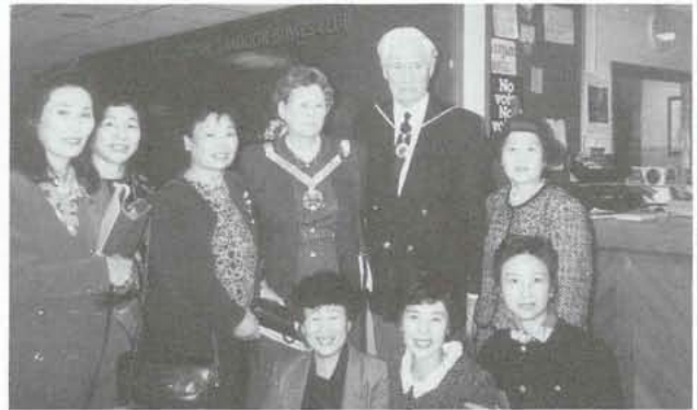
▲ 女性の議会議長さんご夫婦と一緒に

十三社投資しているビジネス基地ミルトンキーンズなどを視察。また女性議員との意見交換も行ないました。スイスでは哲学者ペスタロッチ記念館と孤児達が生活している村を見学。ジュネーブでは、国際婦人同盟と交流。そしてフランス語圏で牧歌的な風景のバイエンス地方において二泊三日のホームステイ。ここでは言葉が通じず困