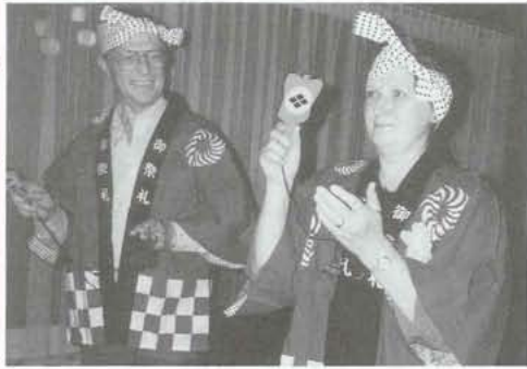
▲ ホームステイ先ではハッピーをプレゼント

研修の成果を上げるため出発前の事前研修において、第一班は教育・社会参加、第二班は労働、第三班は福祉と三つの班に分かれ、第一班に属した私は、教育面、成人学校などについて研修しようと思いましたが、イギリスでは成人学校、障害福祉施設、日本企業も四