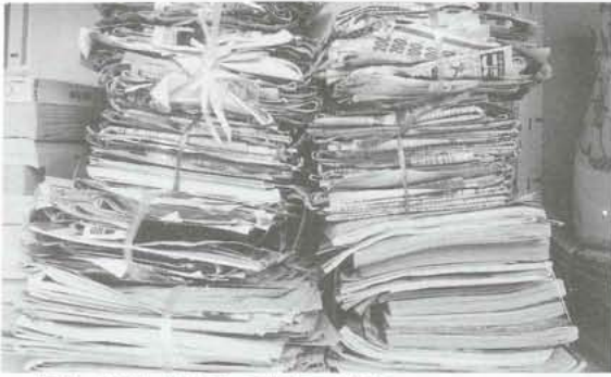
▲新聞、雑誌などは縛って出してください。

町ではこれまで、「資源ごみ回収協力の家」二百四十戸のみならぬの協力により、月平均一・五トンの有価物を回収してきました。しかし、「回収日が限られているため有価物が出しにくい」などの意見が多かったため、今回、二十四時間いつでも持ち込みができる、有価物回収ボックスを各地区に設置しました。