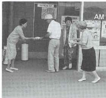
▲明るい社会は私たちの手で

本町では、町内の保護司さんや更生保護婦人部のみなさんが中心となって、町内を宣伝カーで巡回するなど、街頭P.R活動をを行いました。