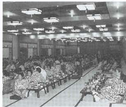
▲毎年恒例の大宴会が行われました。

ながら旅の疲れをいやし、大宴会場で行われた宴会では、カラオケ大会などで盛り上がりました。また、今回の生きがいバス旅行に参加した九十歳以上のお年寄り三人に、泉町長から記念品が贈られました。