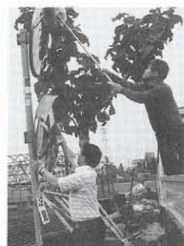
▲交通事故に気をつけて

ドライバーや歩行者のみなさんも、きれいになったカーブミラーや標識をよく見て、交通安全に心がけましょう。