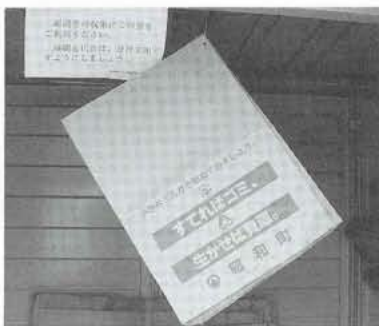
▲ボックスの中に、新聞などを入れておける袋が用意してあります。