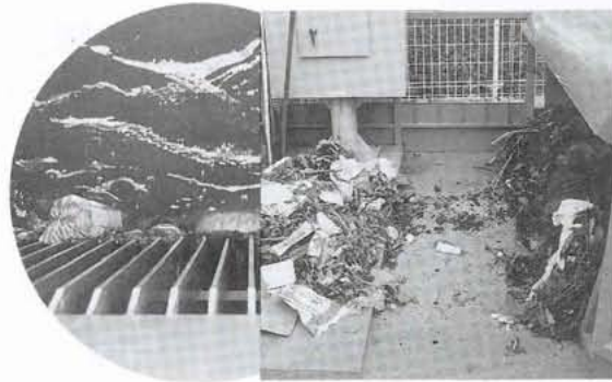
▲スクリーンですくい上げられたごみ

河川を浄化するためのごみ取りスクリーンは、現在県営玉川団地東側を流れる東川に設置され稼働しています。