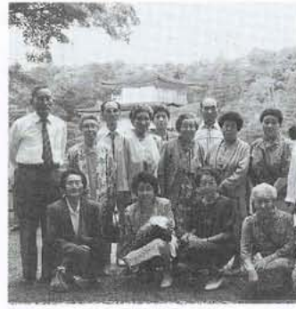
▲金閣寺をバックに記念撮影

町老人生きがいバスの一行が、六月十五・十六日の二日間、初夏の京・近江路を訪れました。この一泊二日のバス旅行は毎年行われています。一行二百三十二人はバス六台に分乗して、金閣寺や二条城、嵐山、比叡山などを見学しました。