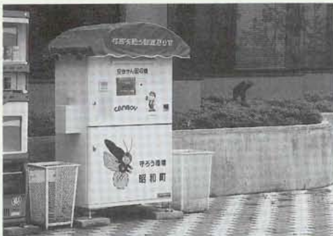
▲つぶれた缶は、機械に入りません