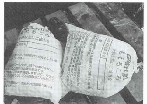
▲収集袋には名前を記入してください

現在のごみの収集方法は、燃え るごみと燃えないごみを、曜日を 変えて収集しています。みなさん のご協力、また地区の衛生委員さ んを中心とした役員の方々の努力 で、以前に比べ、ごみの出し方、 また収集場所はきれいに保たれる