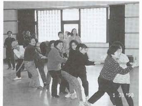
▲みんなで参加した「つな引き」

健康づくりコーナーでは、エアロビクスやつな引き、体位・体力測定が行われ、みんなで参加して体を動かしていました。そのほか、甘酒や豚汁の無料サービスコーナーやおでんなどの販売コーナーには、長い列ができていました。