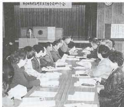
▲3町合同で研修する委員のみなさん

れました。委員の任期は三年です が、今回は新しく八人の方々が委 員になりました。