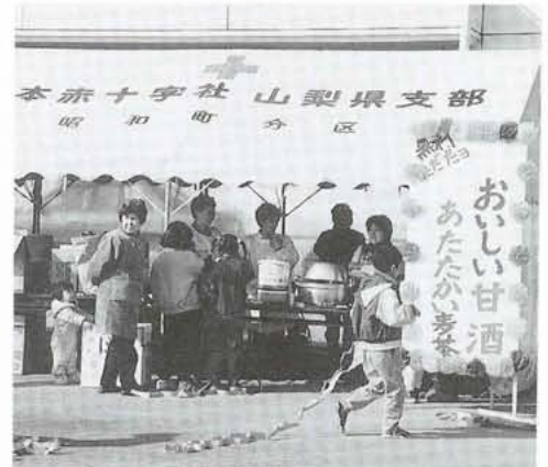
▲たこあげ大会で活躍する子育てボランティアの会のみなさん

今月は、地域の子どもたちのために、二月十一日に「たこあげ大会」を開催した昭和町子育てボランティアの会を紹介します。