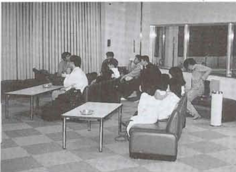
▲運動のあとはロビーでくつろげます。

トレーニングルームを利用したりマシンを使う人は、必ずトレーニングウェアを着用してください。