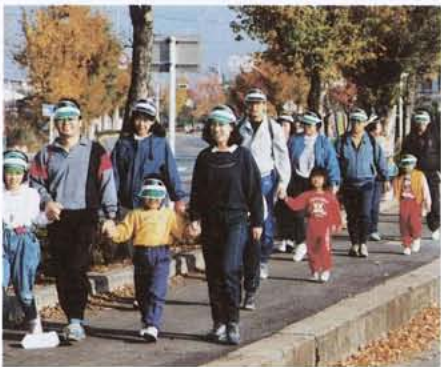
▲枯れ葉舞う昭和バイパスを歩くみなさん

十一月二十二日、健康福祉課の主催する秋風ウォーキング大会が行われ、幼児からお年寄りまで百五十人が、ほちほち・てくてく・すたすたの三コースに分かれウォーキングを楽しみました。当日は、栄養改善推進員のみなさんの、すいとん・おにぎりのサービスマもありとても好評でした。「普段の生活では歩くことが少ないですが、久しぶりに長い距離を歩いていい汗が流せました。この日を機会に歩くことを続けてみたいですね。こんな会話が参加したみなさんから聞かれました。」