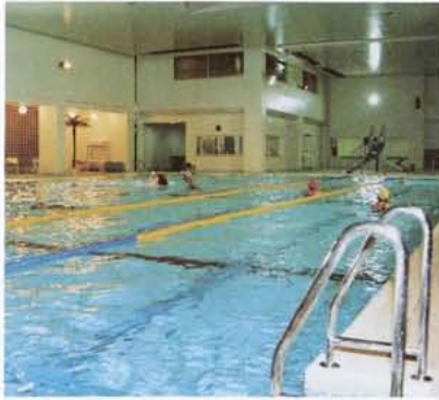
▲水温は28℃に保ってあります