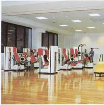
▲各種トレーニングマシンを配備