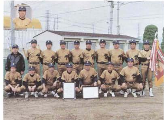
▲町内の50歳以上の男子で構成する町を代表するクラブチームです。

今月は、昨年の十一月三日に行われた第五回中巨摩郡実年ソフトボール大会で、郡下の強豪チームを撃破し見事優勝を果たした実年ソフトボールチームを紹介します。