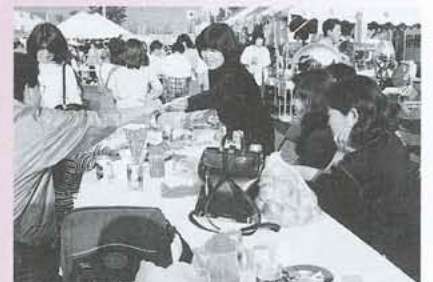
▲バーベキュー広場でのひととき