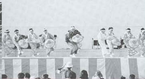
▲河東中島区に伝わる郷土民踊「笠おどり」