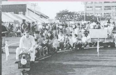
▲親子連れで、電車のりました。