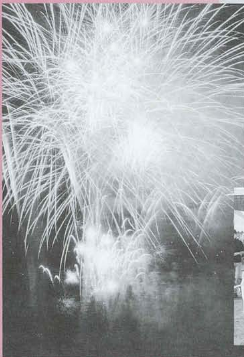
▲夜空をいろどったふるさと花火。