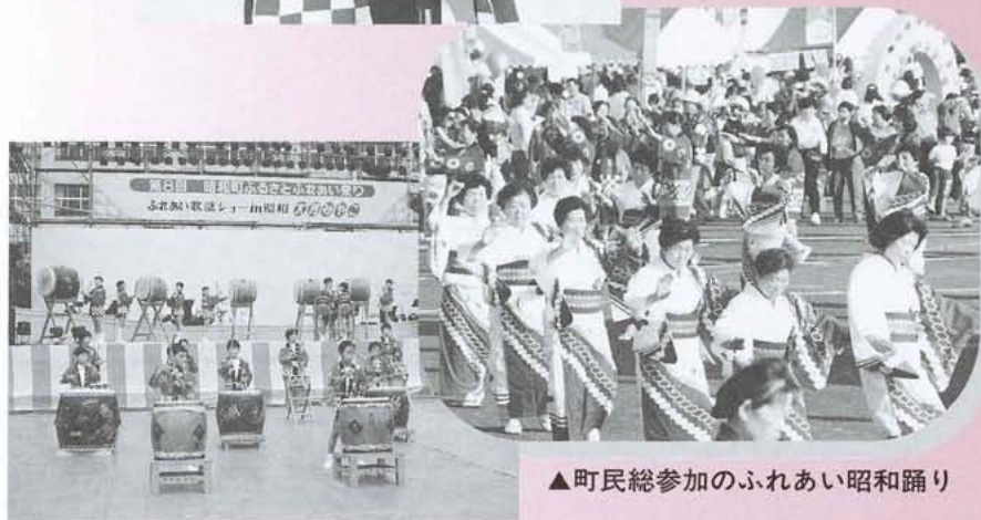
▲子どもたちのほたる太鼓。