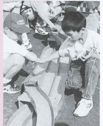
▲子どもたちでにぎわったミニ四駆コーナー