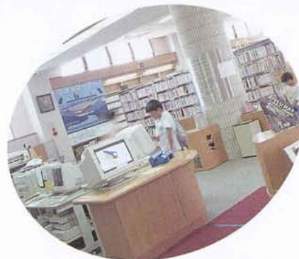
▲県内図書館とネットワークで結ばれた図書館