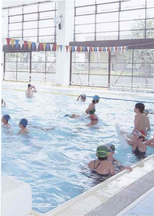
▲温水プールは、町民の健康増進施設として好評。

「青空と緑と産業の町」をキャッチフレーズに、安心して暮らせる町づくり、愛着を感じ参加する町づくり、自然と調和のとれた田園産業都市づくりを進める昭和町。特に、図書館の情報ネットワーク化にいち早く取り組み、また、地域住民の健康増進を図るため温水プールや体育館の整備を進めるなど、地方自治の発展に尽くした功績が認められ表彰されました。