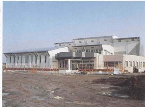
▶完成にむけて工事のすすむ体育館