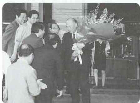
6月2日、役場を後にしました

人格・見識・実力をそなえ、第7代昭和町長として多 大なる功績を残され、このたび退任されました。