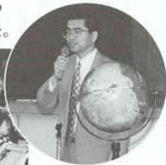
講演は大好評でした