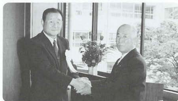
泉前町長とかたい握手を交わしました

選挙中に賜りました町民の皆様 方のご厚情に対し、衷心より感謝 申し上げます、一人ひとりご挨拶に 参上いたすべくとところであります が、就任早々の多用の折りお許し いただき、広報を通しての就任の ご挨拶にかえさせていただきます。