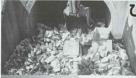
側道沿いの川にたまった空き缶の除去は ショベルカーを使って行われます