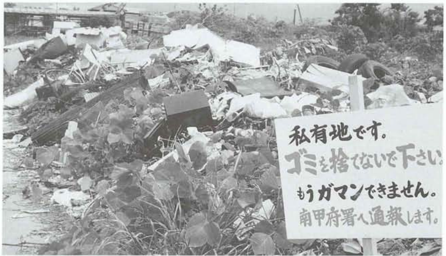
悪質な人になると、粗大ゴミまで捨て放題…これが現実とは！

日本人は世界の恥さらし 経済一流！道徳三流！ ここ数年間、日本人の海外旅行に出かける人の数は飛躍的に伸びました。その理由は①価格の高い国内旅行をするより安い価格で海外に行ける。②新規参入する大手旅行会社の価格競争によりさらに低価格なツアーが増えたことなどがあげられます。