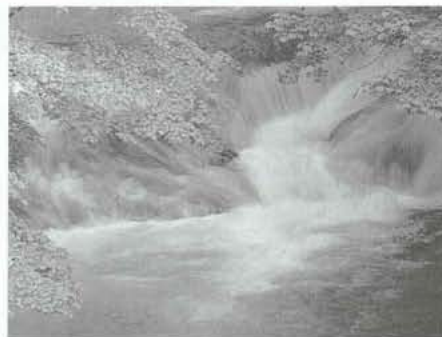
上流の水は透明なのに…