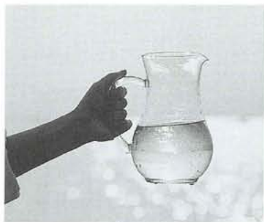
うまい水を未来へ...

財政状況は、経済の低迷により料金収入が4年連続の減収という厳しい状況下であります。行政改革を推進するなかで平成14年度までは現行料金を据え置き、「安全でおいしい水の安定供給」に向け経営努力して参ります。皆さんの水道事業に対する一層のご理解をお願いいたします。