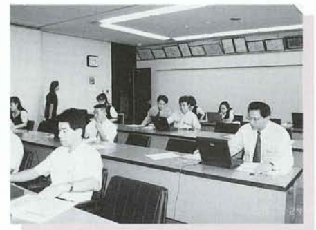
職員パソコン教室から