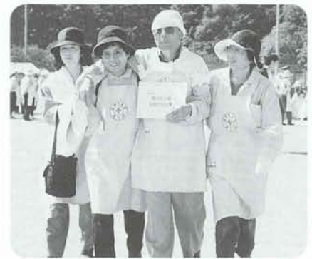
写真は訓練をしている時の1コマです