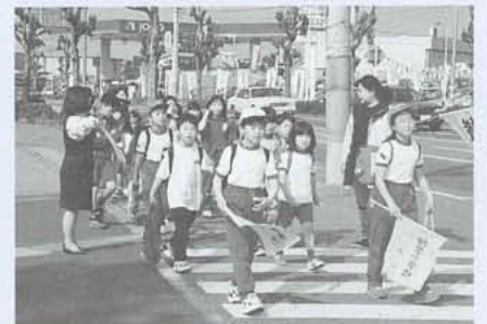
春の交通安全運動期間中に元気いっぱい登校する押原小学校の児童たちです。期間中は、町安協役員さん、各学校の先生方、そして役場職員も児童たちの安全を守るため、街頭指導に協力しました。