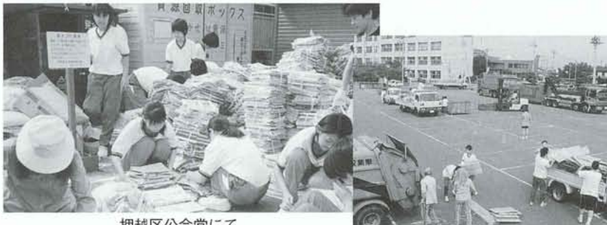
押越区公会堂にて