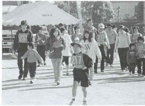
親子そろっての参加も目立った昨年のフェスティバル

今年のスポーツフェスティバルは、より多くの町民が一堂に会してスポーツでいい汗を流し、一人二スポーツの推進が図れるよう計画しました。