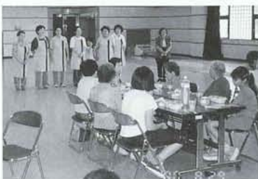
上記記載のふれあいランチ調理を担当した六和会A