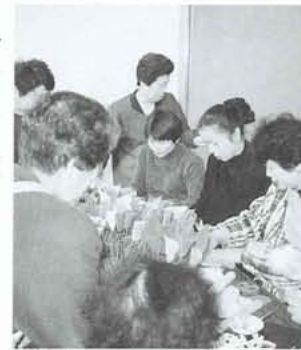
体験コーナーも人気でした

今年の文化祭は、より多くの方々に観賞していただくことと一〇月八日のふるさとふれあい祭りに合わせて開催します。