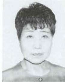
女性いきいきアドバイザー

1、女性の能力開発のため企業に對して研修や訓練の機会の充実を、図るよう働きかけます。 2、女性の就業能力の開発及び向上を図るため、能力開発セミナーを開催します。