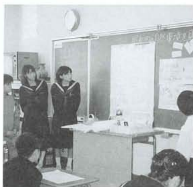
昭和町の自然環境について学習する押中1年生(昨年の学習風景より)

本年度も、教育委員会のご支援と町内小中三校のご協力をいただき、「学校の普段の授業を参観し