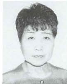
女性いきいきアドバイザー

「◆のところは、子育てにかかる負担の軽減と子どもが健やかに育つための地域環境づくりです」