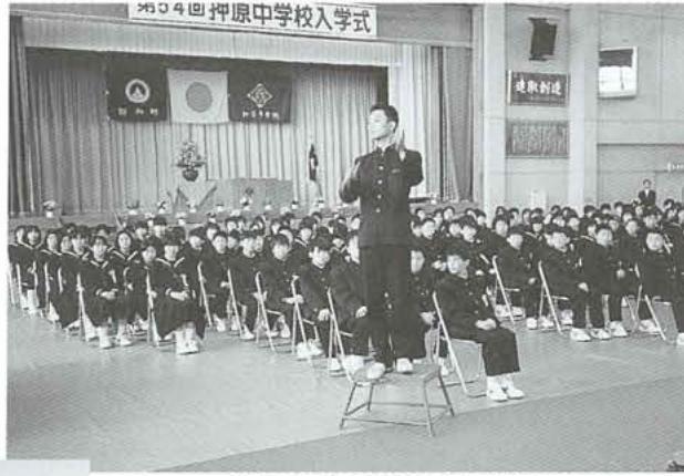
▲歓迎の合唱で指揮をする生徒会長

4月6日(木)に、大勢のご来賓の皆様をお迎えし、保護者出席のもと、厳粛のなかにも明るい和やかな雰囲気ですばらしい入学式が挙行されました。