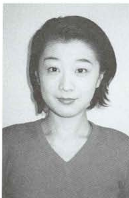
6月1日(木)の街頭PRでお目にかかります。皆さん、いらしてくださいネ!