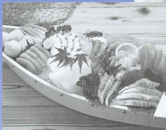
新鮮な海の幸を満喫してください