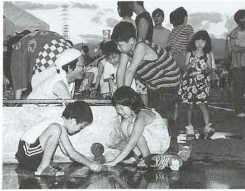
昨年夏の「親子の縁日」から

現況届を提出しないと引き続き受給資格があっても、6月以降の手当を受けられなくなりますので、必ず提出してください。現況届の用紙は該当するみなさんにお送りいたしますが、未着の場合には町