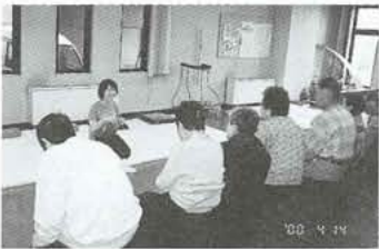
運動不足解消と機能回復に「リハビリ教室」指導者の話に、みなさん真剣です。