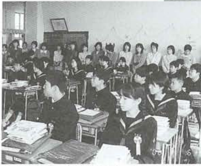
▲入学式後、保護者と一っしょに教室で…

今年度の新入生は、166名で5学級のスタートとなりました。入学式当日、新入生たちは大変心地よい緊張感のなかで、一つひとつの行動にメリハリがあり、また、校長先生をはじめ来賓の皆様が動かない程立派な態度でした。