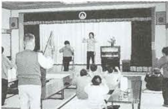
温泉利用者と一緒に「みんなの体操」デイサービスの朝はここから始まります。

e-mail VC19384@em.shakyo.wamnet.wam.go.jp