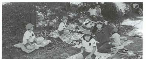
仲よしタイム・みんなでお弁当

このように色々な形で上級生と下級生との交わりが多くなり、休み時間や放課後に下級生に声をかける六年生や「あっぱくの班の○○くん」と言う一、二年生の子どもたちを見ることもある。少しずつではあるが、異年齢集団の関わりが普段の生活の中へ出てきたことはたて割班活動の成果とも