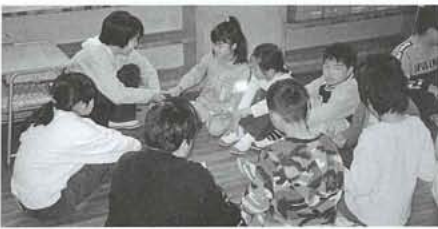
1年生を迎える会で楽しいゲーム

七月には、毎年行われてきた「遊び集会」色々な遊びがある中で今年新しく玉入れゲームを入れた。決められた時間内にくつ玉を入れることができるか競うものがあるが、一年生も六年生も夢中で玉を投げていた。各班の得点はゲームで得た点だけでなく、態度点が加えられることになつてきた。