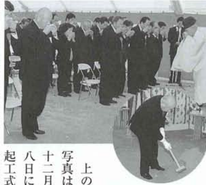
上の写真は、十二月八日に起工式が行われた時の状況です。町議会議員、地元農業委員、学校建設委員等の関係者に出席いただき鴻池組・中西建設昭和町立常永小学校建設工事共同企業体の主催にて行われました。

昨年の十二月に常永小学校建設工事の着工を工事内容とともにお知らせいたしました。今回から工事の進捗状況を下のグラフと写真にて、また工法などの解説を交えながら随時報告します。広報の編集や印刷等の関係上リアルタイムとはいきませんが、ご了承下さい。