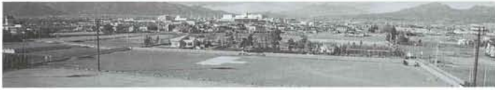
12月末時点での校舎建設地の状況（進捗率1%）

さて、起工式が終了し、いよいよ本格的な工事への着手になります。第一段階として実際の工事施工における施工図（工事の設計段階よりもさらに詳細な部分を把握するための図面）を作成し、工事設計どおりに施工できるかの確認作業があります。この確認作業