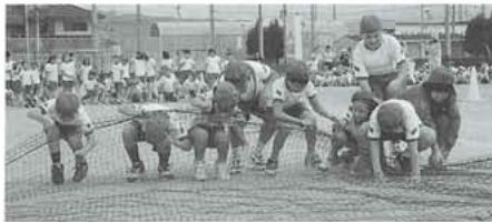
運動会・くもの巣ホイホイ

もう一つたて割班活動がある。それは学期に一回ずつ行われてきた「仲よしタイム」である。これは、家から持って来たお弁当と学校から出された飲み物とデザートを各たて割班毎に食べ、その後班で遊ぶ時間である。最初のころは六年生が考えた遊びをしていたが、下級生の意見も取り入れてほしいということが出て、事前に班の話し合いを持つことになり、みんなで考えた遊びをするようになった。