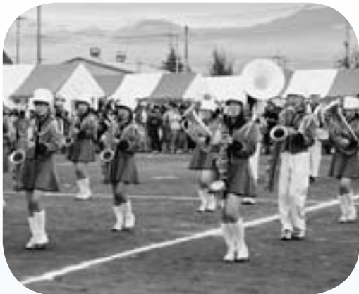
『押中マーチングバンド』 すばらしい演奏でした