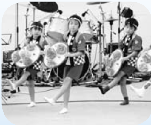
郷土芸能『笠おどり』 子どもたちもがんばりました