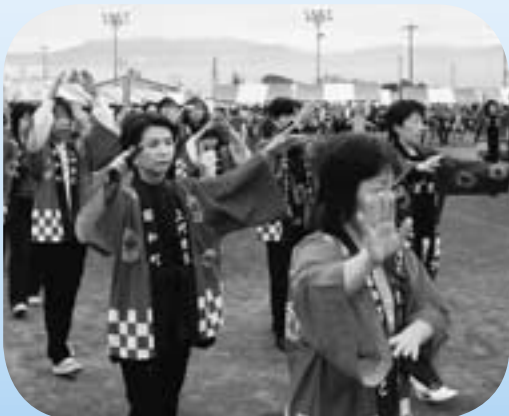
みんなでいっしょに 『ふれあい昭和踊り』