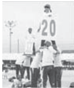
▲組み立て体操「百花繚乱」3段タワー

十日間あまりの取り組みの中で、子どもたちは大きな成長をしました。全校児童による前日の準備では、少しでも演技がしやすいように小さな石まで拾いました。五・六年生は係活動を始め、会場の準備、当日の後片付けと最後まで立派にがんばってくれました。