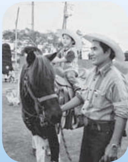
動物・子どもの広場は 子どもたちに大人気！