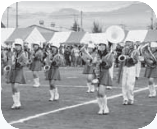
『押中マーチングバンド』 すばらしい演奏でした