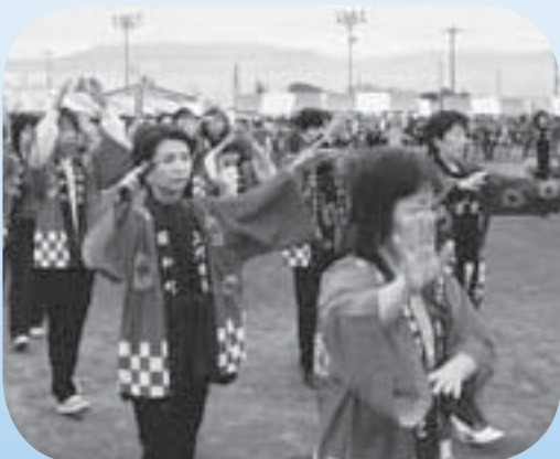
みんなでいっしょに 『ふれあい昭和踊り』