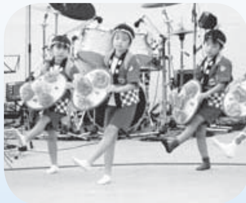
郷土芸能『笠おどり』 子どもたちもがんばりました